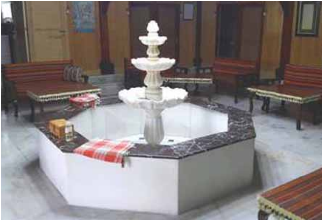
الحمام التركي الحديث