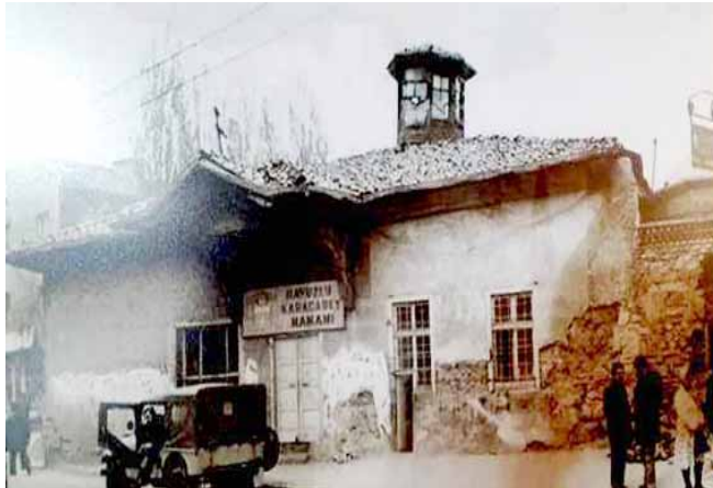
صورة قديمة للحمام