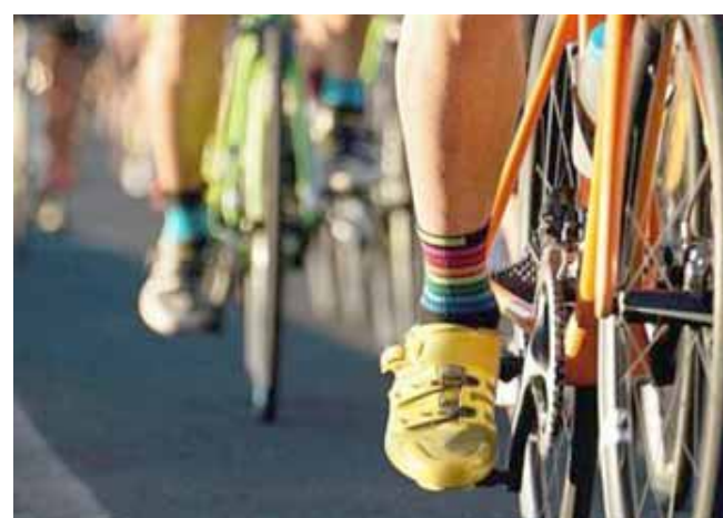
ركوب: يفضل الطلاب عادة الخيارات التي لا تضر البيئة، مثل ركوب الدراجات، لكن سماع صوت معارض قد يغير رؤيتك للمعايير الاجتماعية

وقد أجرت هيغز دراسة في العمل، طلبت فيها من المشاركين تناول الطعام إما مع صديق أو بمفردهم، وانتهت إلى أن وجود شخص آخر يؤثر على قدرتنا على تعيين علامات الشبع، التي قد تغطي عليها رغبتنا في محاكاة الأصدقاء بتناول المزيد من الأطعمة. وقد ثبت أيضاً أن مشاهدة المتلفاز تشتت انتباهنا وتدفننا لتناول كميات أكبر من الأطعمة. ونقلت هيغز أبحاثها إلى المطاعم، حيث وضعت لافتات لتشجيع الناس على تناول الخضروات من طريق تقديم معلوماً عن خيارات الأخرين. وعرضت هيغز في اللافتات أكبر من الحقيقة عن الأطباق الجانبية