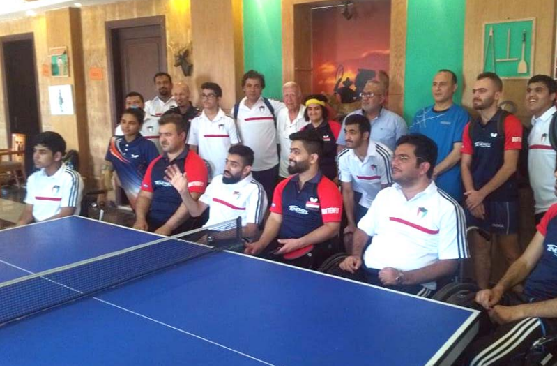
جانب من التدريبات المشتركة مع الكويت في معسكر القاهرة

المهاجري والبيدي باشراف مدرب المنتخب جاسم كاتب مزرعل. وان اللقاءات في الوحدات التدريبية تضمنت خوض التدريب لمدة ثلاث ساعات صباحا ومثلها مساء واكسبت اللاعبات واللاعبات فوننا مضافة لما يحصلونه من اداء متميز اي ان الفائدة جيدة لكل منهما.