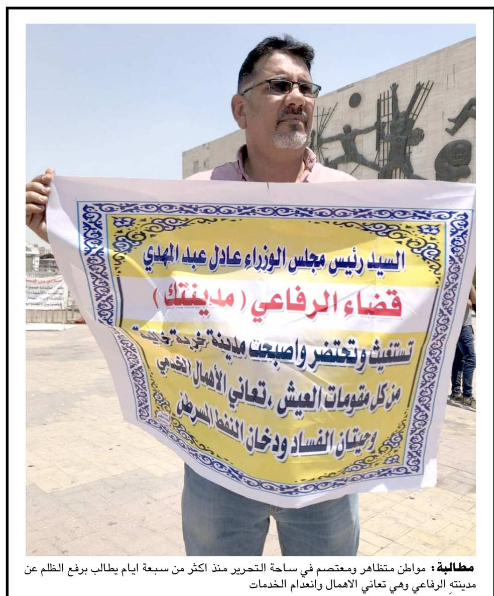
مطالبة: مواطن متظاهر ومحتص في ساحة التحرير منذ أكثر من سبعة ايام يطالب برفع الظلم عن مدينته الرفاعي وهي تعاني الاهمال وانعدام الخدمات

القانونية اللازمة). وفي ذي قار . تمكنت مديرية شرطة قلعة سكر من كشف ملايين جريمة قتل ارتكبتها في فتح مراكز الشرطة كونها منطقة سترراتيجية وتحد بين اربع محافظات). وكانت القوات الامنية قد نفذت عملية قفّيش واسعة في الطارمية للاحقة للطلوبين وتعيين الاستقرار الامني في المنطقة . وعلى صعيد متصل ، أعلنت قيادة عمليات عن اعتقال 3 متهمين بسرقة وخذاع كبار السن من قبل مكافحة اجرام بغداد. وقال بيان إن (قوة من مكتب مكافحة اجرام المنصور التابع لمديرية مكافحة اجرام بغداد تمكنت من القضاء القبض على 3 متهمين يقومون بعمليات سرقة وخذاع لكبار السن).