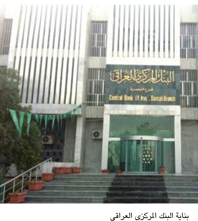
بنية البنك المركزي العراقي