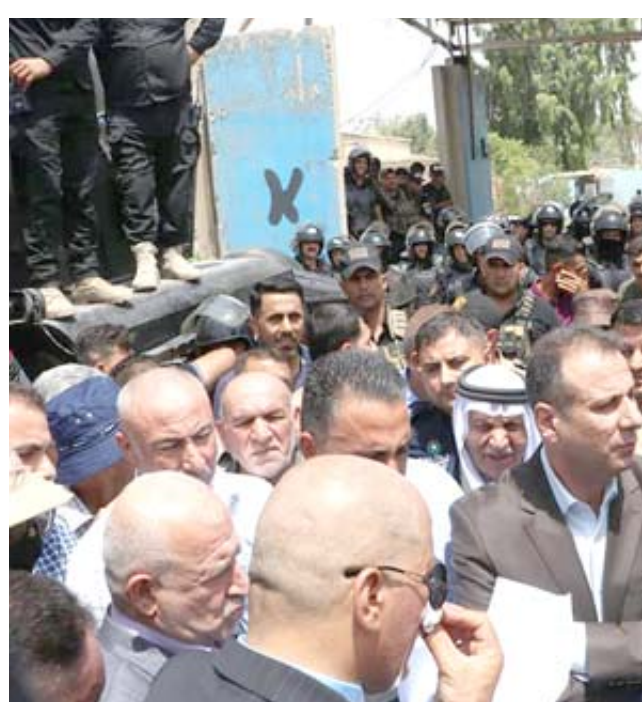
مطالب : رئيس مجلس محافظة ديالى على الدابي يتسلم مطالب المتظاهرين

انطباعات مهمة وأضاف البيان انّ (الإفصاح في الموعد المحدد وبرأي إيجابي يولد انطباعات مهمة لدى المؤسسات والبنوك الدولية التي يتعامل معها العراق، ويعمل على تشجيع المستثمرين على التعامل مع المؤسسات المالية والمصرفية في العراق ما دامت الجهة الرقابية القطاعية - بنك المركزي- تتمتع بهذا القدر من الرصانة، على حد قوله . من جهة أخرى سجلت اسواق العملة الأجنبية في بغداد امس الأربعاء استقراراً يسعّر صرف الدولار الأمريكي مقابل الدينار العراقي. ويبلغ سعر السوق في بورصة الكفاح ببغداد 1200 دينار للدولار الواحد، أي 120 ألف دينار