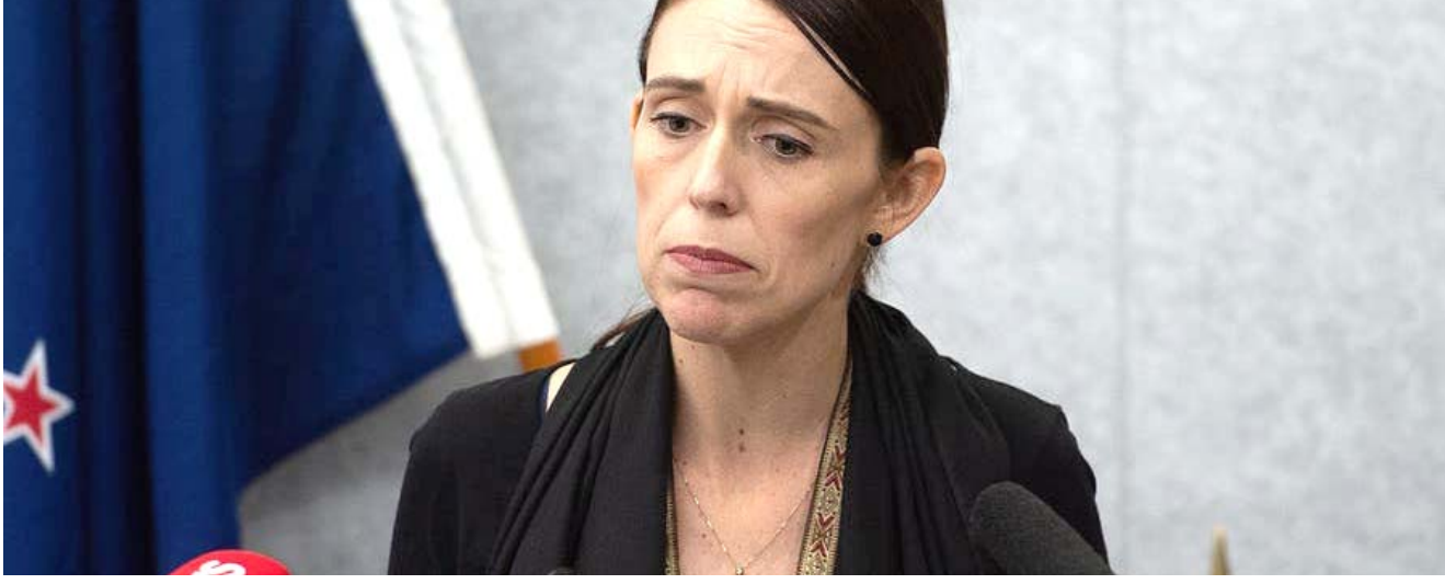
رئيس وزراء نيوزيلندا جاسيندا اردرن

تحقيق ما ذهبنا إليه) مؤكدة ان (نيوزيلندا ستزيد إسهاماتها المالية الرامية لرساء الاستقرار بالعراق إلى ثلاثة ملايين دولار نيوزيلندي خلال الأعوام الثلاثة المقبلة مقابل 2.4مليون خلال عامي 2018 و2019) وأوضحت اردرن انه برغم الهزيمة التي لحقت بداعش على الأرض في العراق وسوريا، فإن التهديد مستمر ويحتاج العراق لدعم دولي نحو التعافي والاستقرار) ووافقت نيوزيلندا في 2015 على إرسال 143 فرداً من قوات الدفاع إلى بغداد للمشاركة في تدريب القوات العراقية على قتال داعش تتركز في معسكر التاجي شمال بغداد. الى ذلك حذرت مجلة