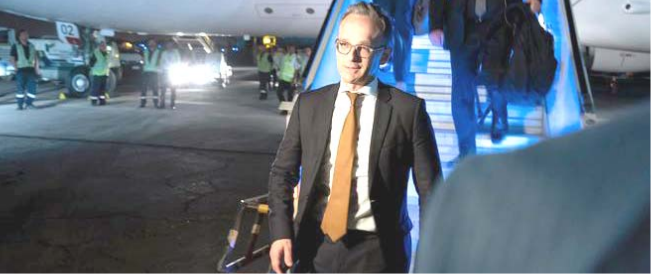
زيارة: وزير الخارجية الألماني في مطار طهران التي زارها أمس

كاتبه استاذ العلوم السياسية في جامعة واسيدا في طوكيو إن ابى (بحاجة الى نجاح دبلوماسي في وقت وصلت فيه جهوده الى طريق مسدود بشأن روسيا وكوريا الشمالية). وأضاف(لكن اليابان لم تؤد ابدا دورا فاعلا في قضايا الشرق الاوسط لذلك لا أتوقع الكثير في مجال النتائج). وراى ان(الامر الملح في الوقت الراهن هو خفض مخاطر اندلاع نزاع عسكري، ما يعني ان ابى يمكن ان يستخدم الدبلوماسية المكوكية لإبقاء الاتصالات قائمة). وفي الشأن نفسه بحث وزير الخارجية الابرايي محمد جواد ظريف مع نظيره الألماني هايكو ماس في طهران صباح اليوم الاثنين مستقبلا الاتفاق الدولي الأوروبي الثلاث للاتفاق النووي، وقال(نحن نحاول استمرار الحفاظ على الاتفاق النووي) وقال (لقد كان إيران الى طبيعتها). من جهةه أكد الوزير الألماني مجددا دعم الدول الأوروبية الثلاث للاتفاق النووي، بشأن الملف النووي الإيراني، وقال ظريف خلال مؤتمر صحفي مشترك مع ماس إن (أمريكا أعلنت الحرب الاقتصادية على إيران). مؤكدا أن (هذه الحرب خطيرة للغاية على المنطقة والعالم والنظام الدولي). وأضاف (اجريتا محادثات صريحة وجادة مع ماس وطهران ستعسان مع الدول الأوروبية الموحدة على الاتفاق لإنقاذه). وتابع (لا يمكن لأحد ان يقوم بخطوة ضد