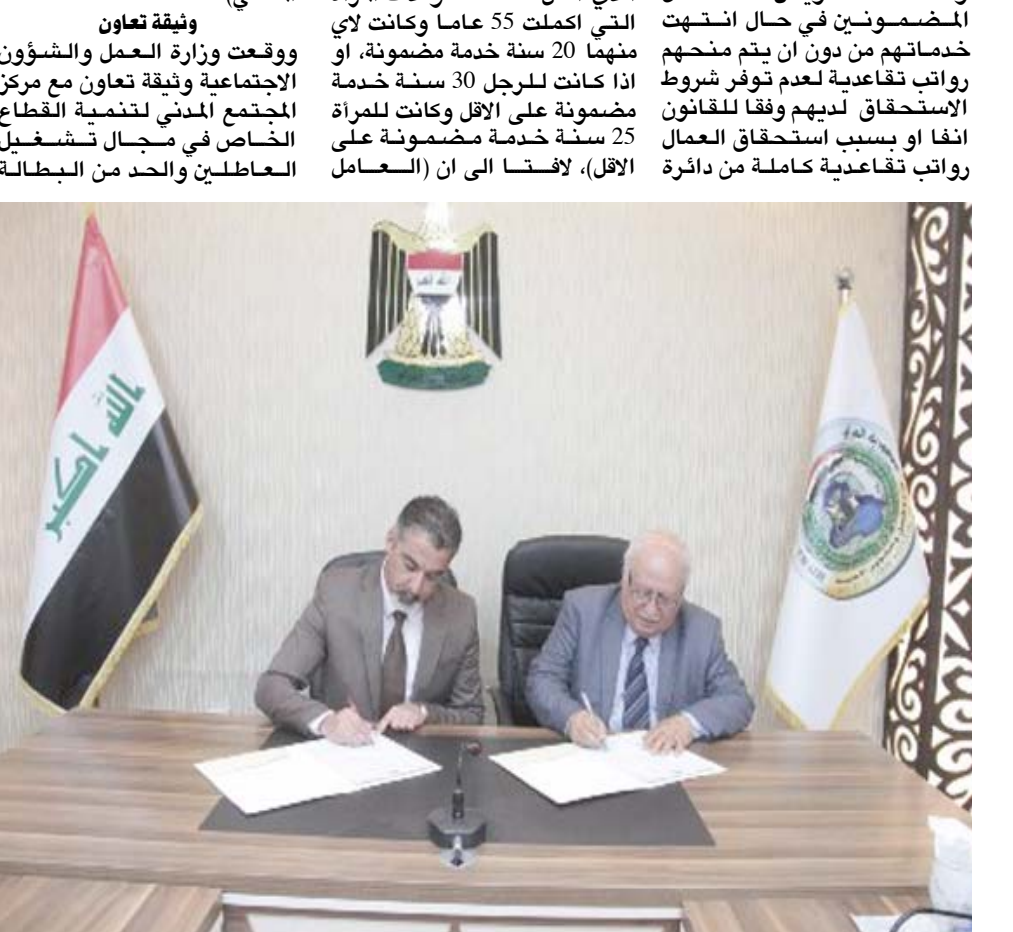
توقيع : وزارة العمل وثيقة تعاون في مجال تنمية القطاع الخاص

ووقعت وزارة العمل والشؤون الاجتماعية وثيقة تعاون مع مركز المجتمع المدني لتنمية القطاع الخاص في مجال تشغيل العاطلين والحد من البطالة