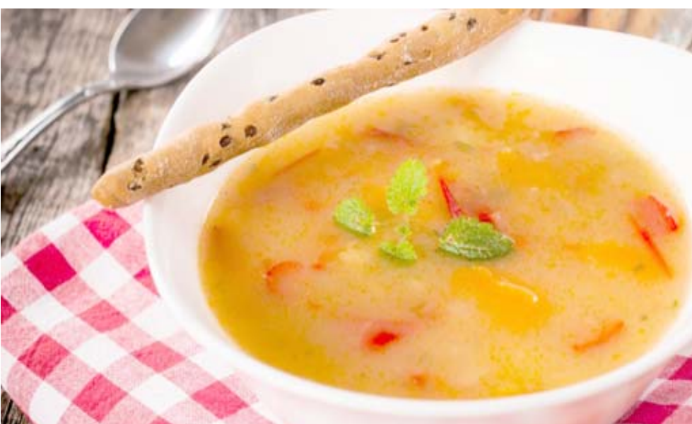
فوائده : الحساء ينظوي على فوائد عديدة

بالإمتلاء (الشبع). 5 نصائح غذائية للمسنين على صعيد آخر بعد اتباع نظام غذائي صحي امرا في غاية الأهمية، لكن مع التقدم في العمر يصبح من الصعب الحفاظ على العادات الغذائية الصحية لعدة أسباب، خاصة بالنسبة للمسنين الذين يعيشون بمفردهم؛ حيث اظهرت الدراسات ان (كبار السن يعانون من سوء التغذية الامر الذي يعرضهم لشاكل صحية كثيرة، وقدم الخبراء خمسة نصائح غذائية يتعين على كبار السن الالتزام بها حتى يتعمون بصحة افضل وهي إضافة الاطعمة الغنية بالبروتين للنظام الغذائي للكار يجعلهم أكثر صحة، ويكون من الأسهل بالنسبة لكبار السن خاصة الذين يعيشون بمفردهم تناول خبيارات البروتين الجاهزة مثل الزبادي اليوناني.