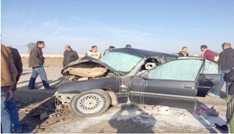
حادث مؤسف نتيجة تخسفات في احد الشوارع

ان تكون كل اروققتها مناسبة لزيادة جرعات الإهتمام بهذه المدينة التي عانت الايرين سواء من خلال سقوطها بايدي تنظيم داعش او غيابه الإهتمام بها بعد تحريرها سواء الشوارع ونامل جاهدين ان تكون حادثة العبارة وما رافقها من اهتمام محلي بمقرات المدينة ومطالبة اهاليها باهتمام أكبر في