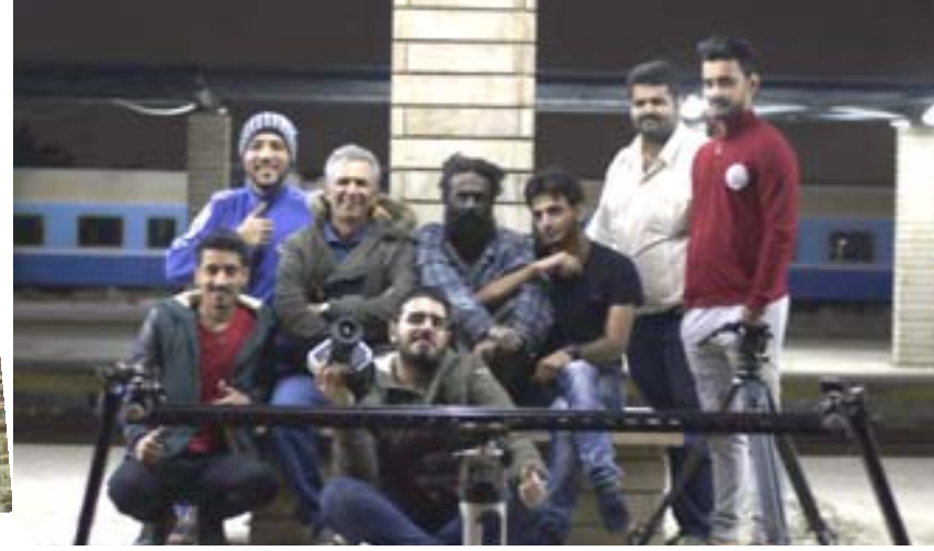
سينما الشباب : أسرة فيلم (مانشيت) والمصق الترويجي للعمل