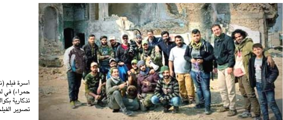
أسرة فيلم (نافذة حمراء) في لحظة تذكارية بكارليس تصوير الفيلم