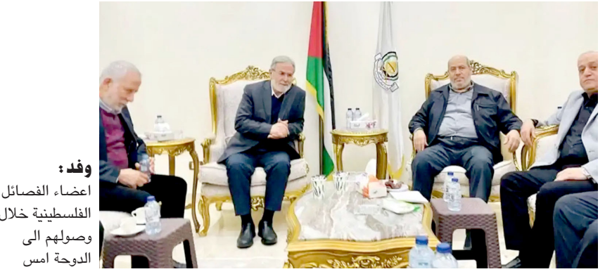
وفد: أعضاء الفصائل الفلسطينية خلال وصولهم إلى الدوحة أمس

القيادة العامة، في حين وصل إلى الدوحة أيضاً، قبل يومين، رئيس هيئة شؤون الأسرى الفلسطينية قدورة فارس. وأعرب الكرملين عن، تفاؤل حذر بشأن اتفاق لوقف إطلاق النار في قطاع غزة، عدا أنه من (الضروري للغاية وقف الأعمال إزاء كارثة إنسانية في القطاع، وقال المتحدث باسم الرئاسة الروسية دميتري بيسكوف في تصريح أمس إن (وقف إطلاق نار وهدنة أسرار ضروريان للغاية من أجل السكان المقيمين في غزة والذين يعانون من هذه المحنة غير الإنسانية على الإطلاق وهم بحاجة إلى وقف إطلاق نار وكل أنواع المساعدات الإنسانية الممكنة). إلى ذلك، أكد المفوض