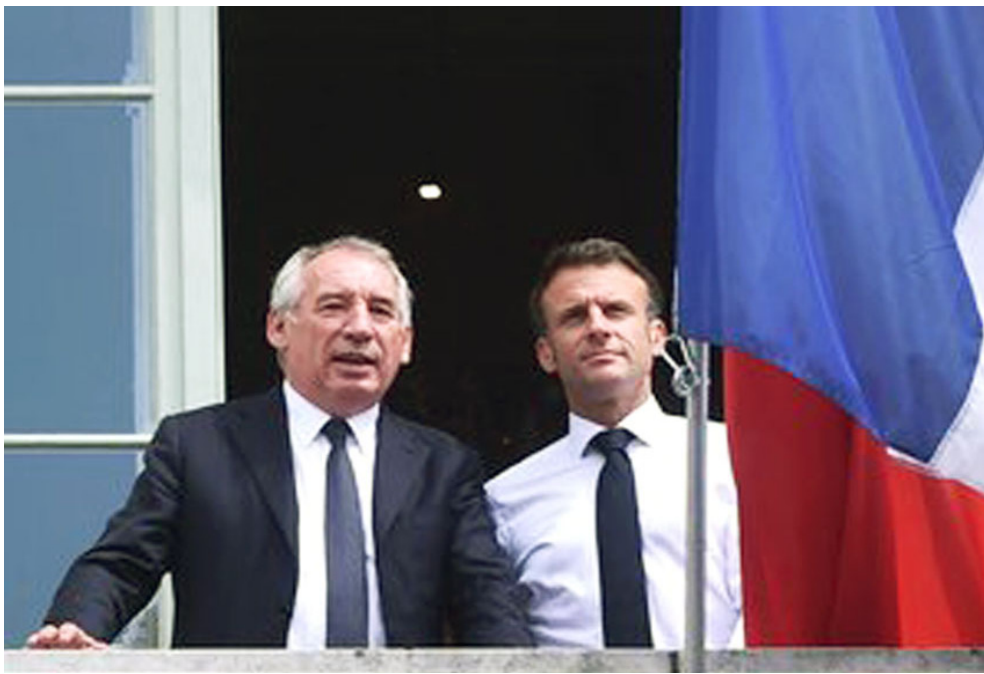
خطاب: الرئيس الفرنسي ورئيس وزرائه خلال خطاب في باريس

وفي رسالة إلى مجلس الأمن الدولي في كانون الأول/ديسمبر، أعربت فرنسا وألمانيا والمملكة المتحدة عن قلقها الكبير، وحثت الجمهورية الإسلامية على وقف تصعيدها النووي على الفور، كما ناقشت الدول الثلاث احتمال تفعيل آلية إعادة فرض العقوبات على إيران لمنعها من امتلاك السلاح النووي واعتبر الرئيس الفرنسي إيمانويل ماكرون، الأسبوع الماضي، أن إيران تشكل «التحدي الإستراتيجي والأمني الرئيسي» في الشرق الأوسط، محذرا من «تسارع برنامجها النووي» ومن جانبه كان قد أكد وزير الخارجية الإيراني عباس عراقجي مؤخرا أن بلاده «ستوجد المزيد من الثقة بشأن الطبيعة السلمية، لبرنامجها النووي مقابل رفع العقوبات