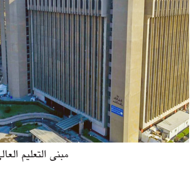
مبنى التعليم العالي

الجامعة الإسلامية في المرتبة الثالثة). وادرجت الوزارة جريمة سبايكر ضمن المنهاج الدراسي للجامعات. وأشار البيان الى انها (بصدد استكمال اعداد المنهاج الخاص بالديمقراطية وحقوق الانسان وادراج مواضيع مساوي الفكر التكفيري والحديث عن الحقبة الزمنية لداعش لجزء من ارض الوطن والبطولات التي سطرها ابناء القوات المسلحة بصنوفها كافة بما فيها الحشد الشعبي والمضمون اليه من متطوعي العشائر والبيشمركة في معركة التحرير المقدسة). وأوضح البيان انه (اتلاقاً من اهمية التثقيف والتوعية ضد جريمة مجزرة سبايكر التي ارتكبتها داعش، وتخليداً لذكرى شهداء المجزرة من ابناء العراق، تم توجيه الجامعات لتشكيلاتها كافة باقامة مراسم سنوية لاحياء ذكرى مجزرة سبايكر، كونها واحدة من ابشع