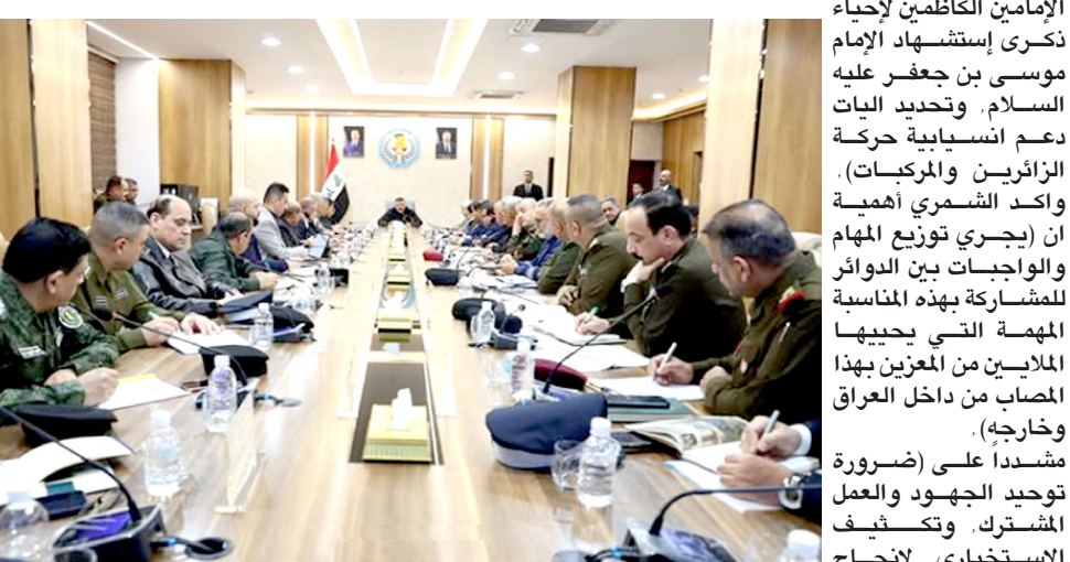
مؤتمر: وزير الداخلية خلال مؤتمر بمشاركة الجهات الأمنية لتأمين الزيارة الرجبية

بغداد - صباح الخزعلي تستعد وزارة الداخلية لتأمين الزيارة الرجبية في مدينة الكاظمية المقدسة، وذلك ببيان تلقته (الزمان) امس ان (وزير الداخلية، عبد الأمير الشمري عقد مؤتمراً بمشاركة الجهات الأمنية والخدمية لتأمين الزيارة الرجبية المصادفة ليوم 25 من الشهر الجاري). وتطرق المؤتمر إلى (وضع الخطط الأمنية والخدمية خلال أيام زيارة