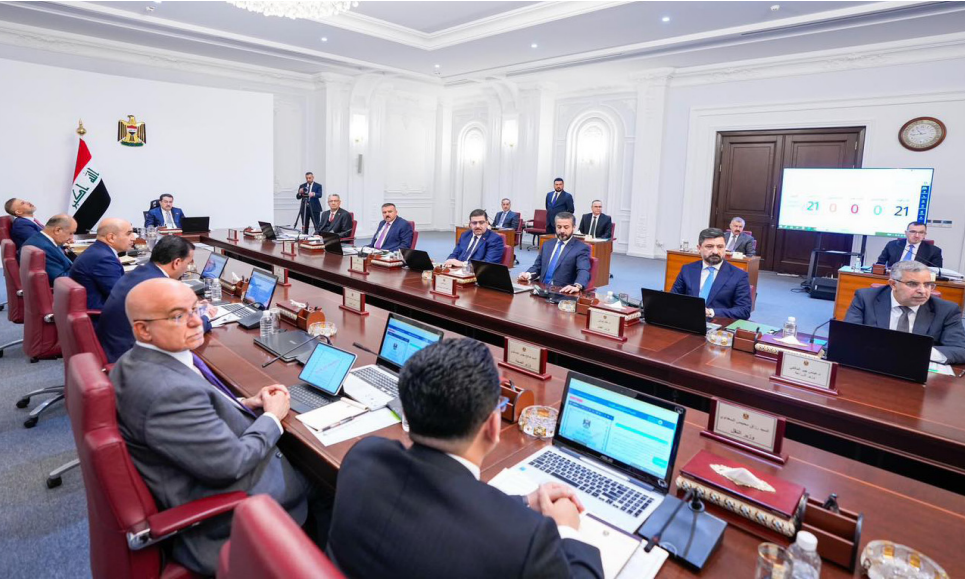
جلسة: إحدى جلسات مجلس الوزراء برئاسة محمد شياع السوداني