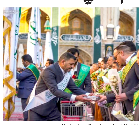
تهنئة: العتبة العلوية تلقى التهاني بولادة الامام علي بن ابي طالب عليه السلام

احتفالية تعكس عمق الارتباط بهذه الذكرى العظيمة، ومضى البيان إلى القول إن (العتبة شاركت بتنظيم احتفال مركزي استقطب الآف الزائرين، الذين عبروا عن ارتباطهم الروحي بالإمام علي، وتابع البيان ان (برنامج العتبة الاحتفالي الذي استمر لمدة أسبوعاً كاملاً ، تحت شعار أسبوع وليد