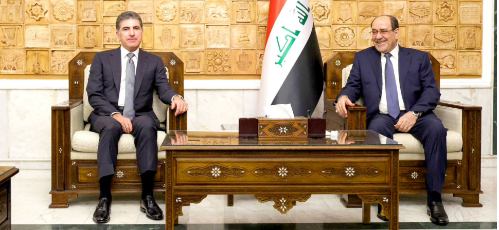
لقاء: نوري المالكي ونيجرافان البارزاني خلال لقائهما في بغداد

السياسي والأمني في البلاد والمنطقة، وأضاف ان (اللقاء تطرق إلى التحديات التي تواجه المنطقة وتداعياتها على العراق، وسبل إيجاد مخرج لازمات الراهنة، فضلا عن القضايا المتعلقة بمصالح المواطنين، والعمل على إيجاد حلول لتنظيم الالتزامات المتبادلة بين الحكومة الاتحادية والإقليم، وفقاً للدستور وما تم إقراره في قانون الموازنة العامة الاتحادية)، وشدد الجانبان على (أهمية التنسيق والتعاون المشترك بين القوى الوطنية لمواجهة التحديات في البلاد، بما يحقق مصالح جميع أبناء الشعب)، ووجه البارزاني (دعوة للمالكي لزيارة الإقليم)، من جانبه، رحب المالكي بالدعوة، معرباً عن أمه (في أن تسهم هذه الزيارة في تعزيز العلاقات والتفاهم بين الجانبين). كما بحث البارزاني مع رئيس تحالف السيادة خميس الخنجر، أبرز الملفات في الساحة العراقية من ضمنها ضرورة تمرير ورقة الاتفاق السياسي والملفات المتعلقة بين أربيل وبغداد، وقال بيان تلقته (الزمان) امس ان