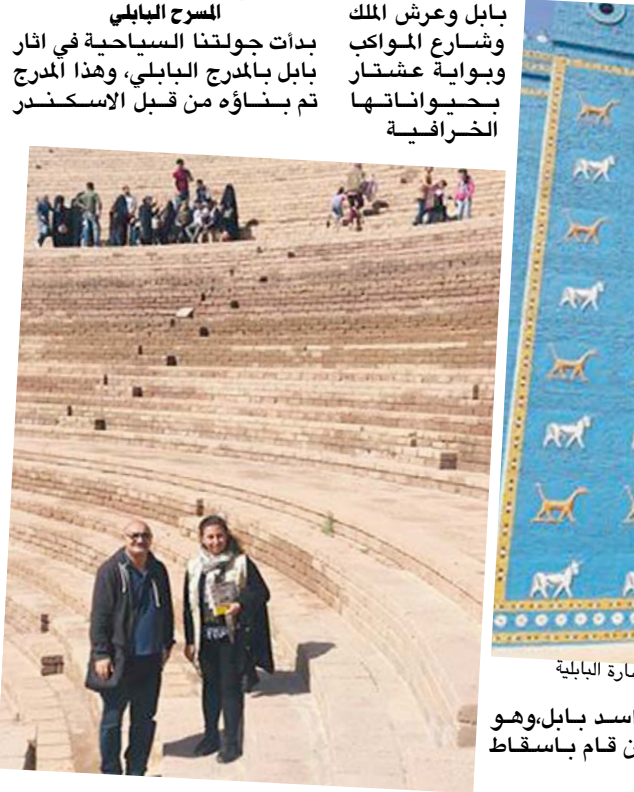
بوابة عشتار ومدنجات مسرحها رمز الحضارة البابلية

شهرة من بين ملوك العراق بسبب (مسلة حمورابي) والقوانين التي شرعت في عهده لتنظيم (معايير السلوك وحقوق الملكية والسيول الاجرام والعبودية والزواج والطلاق) والبالغة 282 قانون ودام حكمه 43 عاما ، بعدها جاء حكم الدولة الآشورية ولم تسترد بابل عظمتها الا على يد الملك الآخميني والاعظم (نيبوخذنصر) الملك الكلداني والذي يعني (حامي الحدود) وهو من انشأ مملكة بابل في العهد الثاني واستمر حكمه من 605 - 562ق.م، وشيد المعابد والقصور وبرج بابل وعرش الملك وشوارع الموكب وبوابة عشتار بحيواناتها الخرافية