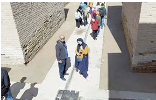
شارح الموكب ابرز معالم بابل

مدينة اورشليم القدس مرتين الاولى عام 597 ق.م والثانية عام 587 ق.م وقام بسبي اليهود كما اشتهر ببناء (الجنائن المعلقة) هدية لزوجته القادمة من بلاد فارس وطبيعتها الجميلة الخلابة ودام حكمه 43 عاما ، بعدها جاء حكم الدولة الآشورية ولم تسترد بابل عظمتها الا على يد الملك الآخميني والاعظم (نيبوخذنصر) الملك الكلداني والذي يعني (حامي العصور ، العصر السلوقي ودخول الإسكندر المقدوني والعصر الفرقي والعصر الساساني 637-227م حتى الفتح الاسلامي)