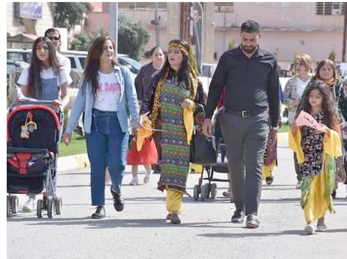
عبدالله مسيحيين من قرقوش خلال احتفال بعيد الشعائين الذي صاقد الأحد الماضي

ذات الاهتمام المشترك بين البلدين ومنها التقدم الحاصل في جهود تفعيل اتفاقية الاطال الإسرائيلي بين العراق والولايات المتحدة الأمريكية كما تم بحث موضوع تسهيل منح سمات الدخول بين البلدين وسبل تعزيز العلاقات التجارية بين الجانبين والاستعدادات المتعلقة بالاجتماع مجموعة دعم الإستقرار في العراق الذي سيعقد للمرة الأولى مرة في بغداد بعد غد الخميس).