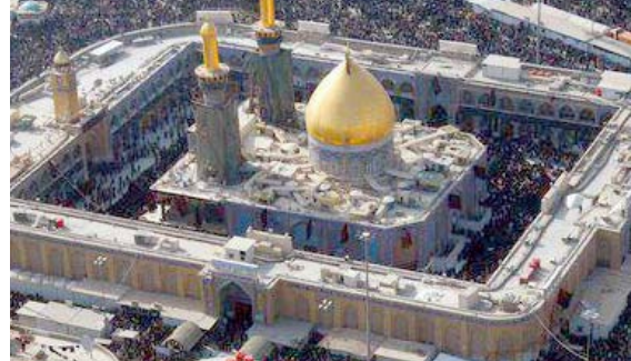
إساس الساموك في بيان تلقته

رئيس مجلس النواب، ووزير العدل/ إضافة لوظيفةتهما). وأضاف مسؤولون (المدعي طلب الحكم بعدم تسوية البعثتين فانياً وخصاً من المادة 50 من القانون المذكور، والبقاء الأولى المترتبة ومنها تعلمت منح مخصصات بدل أزياء لحراس الاصلاحين في دائرة اصلاح الاحداث رقم 2 لسنة 2018). وأشار إلى ان المحكمة (وجدت ان القانون، المطعون بعدم ملاءمته بنود منه، يتضمن جنحة مالية، بما يتلزم الوقوف على رأي رئيس مجلس الوزراء إضافة لوظيفته، لمعرفة مدى التغييرات الحاصلة على القانون قبل تشريعه، وتأثير ذلك على الموازنة المقدمه من الحكومة الى مجلس النواب ولاستيفاض منه عند بلزم تنفيذ الدعوى، مضيفاً انغرض تبليغه تاجلت المرافعة إلى السادس من الشهر المقبل).