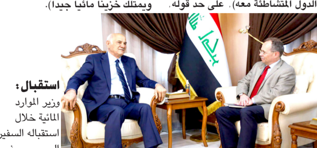
استقبال : وزير الموارد المائية خلال استقباله السفير السويسري في العراق

بغداد - ايهتال العربي ناقش وزير المياه العراقية (استعداد بلاده للتعاون الكامل مع العراق من أجل تطوير قطاع الري، مرحباً بالادعوة الموجه له لحضور فعاليات مؤتمر بغداد بنسخته ذات السفير لترسنته منصبه الجديد للعلم في العراق، مستعرضاً شرحاً مفصلاً عن الوضع الحالي في العراق، والتحديات التي تواجه قطاع الموارد المائية. أزمة المياه ونكر بيان تلقته (الزمان) امس ان (الإجتصاع بحث أزمة المياه وتائر العراق بقلعة الإيرادات المائية وزيادة الطلب على المياه بفعل النمو السكاني وقلّة تساقط الأمطار)، وأشار الوزير الى (الحلول التي وضعتها الوزارة لتجاوز الأزمات والاستفادة من تجارب الدول المتطورة في مجال الري) موضحاً ان (العراق يعد من أول بلدان الشرق الأوسط الذي انظم لاتفاقية هلسنكي للمياه)، وأكد نواب (الاستعداد لفتح آفاق التعاون المشترك بين البلدين، للاستفادة من خبرات الجانب السويسري في إدارة المياه)، لافتاً الى (التعاون المستمر مع معهد خريف للمياه، الذي اسهم بوضع خارطة طريق لعلاقات العراق مع الدول المتشاطئة معه). على حد قوله.