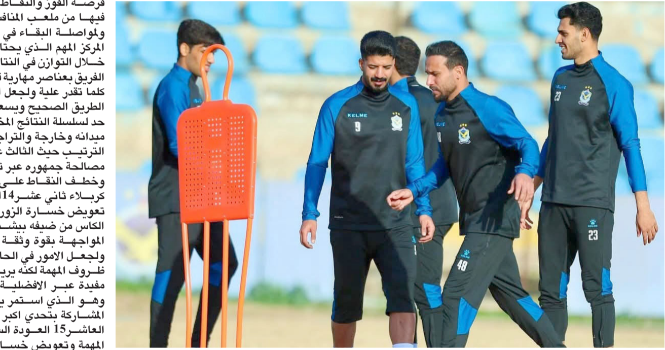
تدريبات: فريق القوة الجوية يستعد لمواجهة الزوراء في دوري المحترفين