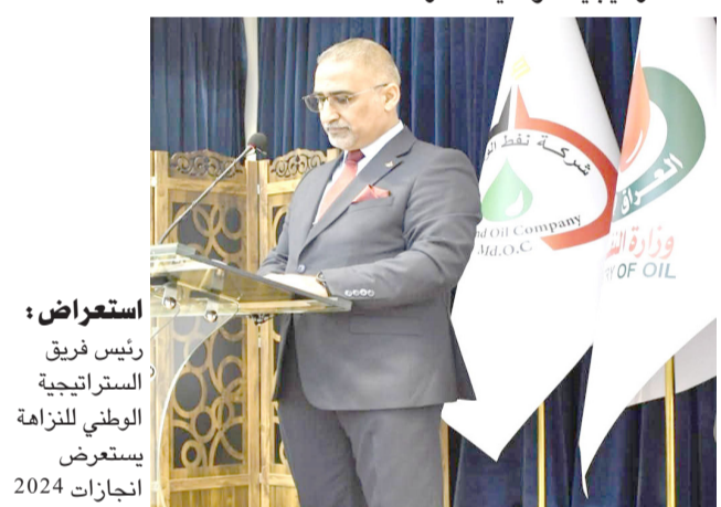
استعراض : رئيس فريق الاستراتيجية الوطنية للنزاهة يستعرض انجازات 2024

بغداد-الزمان بمناسبة اليوم العالمي لمكافحة الفساد، وأسبوع النزاهة السنوي، نظمت شركة نفط الوسط، ندوة موسعة، بحضور وفد من هيئة النزاهة الاتحادية/ دائرة التخطيط والبحوث ومعاون المدير العام للشؤون الفنية ومدراء الهيئات والأقسام المركزية وجمع من منتسبي الشركة. واستعرض رئيس الفريق الفرعي للاستراتيجية الوطنية للنزاهة لمكافحة الفساد.