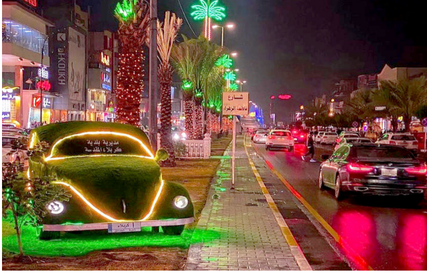
سناثر : لقطة من شارع السناثر في كربلاء

السوق بالإضافة الى توفير فرص عمل للعاطلين من الشباب ومن خريجي الجامعات الذين ظلوا يعانون من شظف العيش على الرغم من مطالباتهم المستمرة. داعين (الحكومات المحلية في المحافظات بمتابعة اسعار السوق الذي انعكس سلبا على الحياة المعيشية للمواطنين خصوصا من ذوي الدخل المحدود والوقوف على احتياجات العوائل المتعففة من الذين لا يمتلكون وراثيا شهرية فضلا عن دعم شريحة الشباب من غير المتزوجين من الذين لا زالوا ينتظرون الاعوام الممتعة من الحكومة وتسهيل امورهم المادية عبر توفير قروض عمل لهم لكي يتمكنوا من مواصلة حياتهم