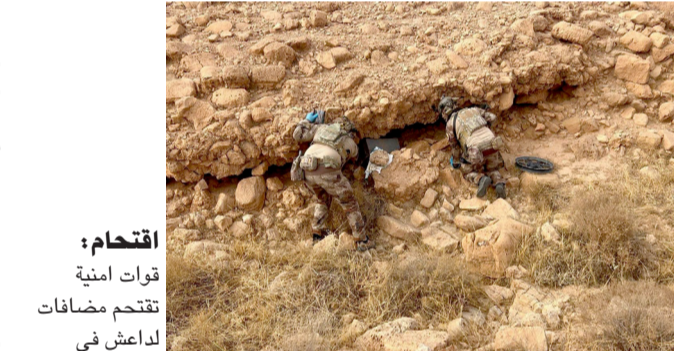
اقتحام : قوات أمنية تقتحم مضافات لداعش في صلاح الدين

ولفت الى ان (المدان اقدم على ترويح وصرف قروض زراعية لمواطنين من دون علمهم وموافقهم، ولم يتم تسديد مبلغ القرض؛ كون سدادها التعمد وسدات الكفالة مُزورة، لإهماله بإداء واجبه ممّا أدى إلى إلحاق الضرر المادي بالمال العام ومصالح الجهة التي يعمل بها)، ووضى البيان الى القول ان (المحكمة بعد اطلالها على الأدلة والإبانات المتضمنة بمحضر اللجنة التحقيقية، وأقوال الممثل القانوني