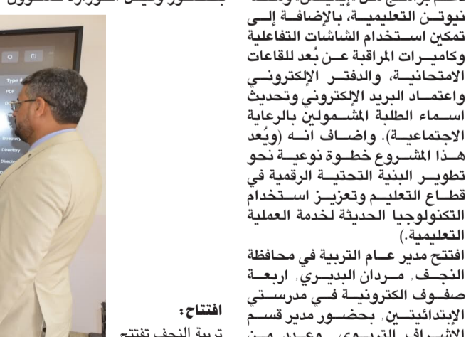
افتتاح : تربية النجف تفتتح صفوفاً الكترونية