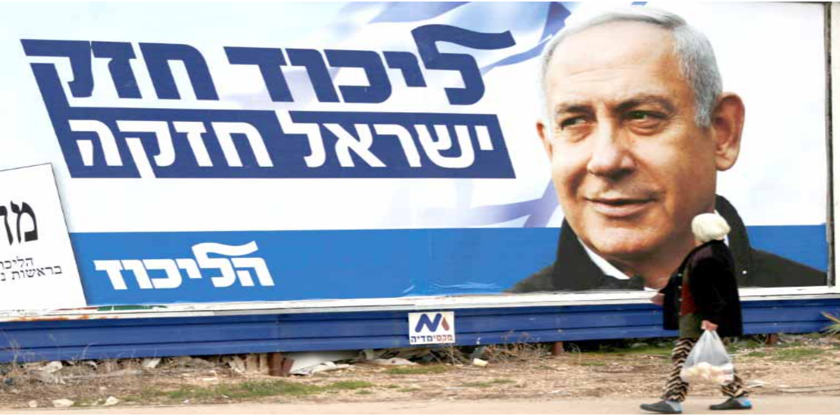
ملصق: اسرائيلية تجتاز ملصقا دعائيا لحملة بنيامين نتنياهو

نتوقع ما الذي ستفعله وسائل الإعلام لكن لحسن الحظ هناك من الصحفيين الإسرائيليين والنشطاء من يتحلون بالشجاعة ما جاء في المقال، ويرى فيسك أن هذا التحول في التعبير ليس مفاجئا إذا نظرنا إلى خضوع الولايات المتحدة التام لمطالب إسرائيل، ولكن هذا الأمر سيكون وبالاً على شعوب الشرق الأوسط. ويقول (تعبت من المعادين للسامية والمعادين فيها الكثير من العنصريين النقاد بشأن معاداة السامية للعرب والمعادين لسود، دون أن نخرج مصطلح معاداة السامية عن سياقهم، وتتهم به جميع من ينتقدون إسرائيل). ويرى أن (الأمريكيين لا يجراون على التذمر من الولاة المزوج لأبناء التهم من الولاة المزوج لأبناء التهم). ويقول (انظر إليهم في الكونغرس عندما يخاطبهم تنتباهو، النواب الأمريكيون يقفون ويصفقون له ثم يجلسون ويقفون مرة أخرى ويصفقون ثم يجلسون ويعودون للوقوف والتصفيق. لقد فعلوا 29 مرة في 2011 و39 مرة في 2015). ويضيف (أتابع دائماً هذا الخوض التشريعي الأمريكي باستناسة، لأنها تذكرني بالتصفيق الذي كان يتلقاه الرئيس العراقي صدام حسين من شعبه المحبوب وما يطلبه الرئيس السوري، بشار الأسد، من رعاياه الأوفياء).