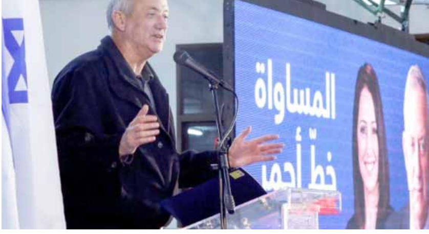
خطاب: رئيس الأركان الإسرائيلي السابق بيني غانتس في خطاب القاء خلال حملته الانتخابية

هذه القائمة إلى المرتبة الثانية خلف قائمة الليكود (يمين) بزعامة نتانياهو.