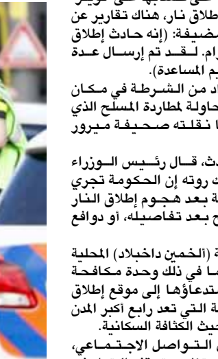
حادث: الشرطة وخدمات الطوارئ في مدينة أوترخت الهولندية بعد حادث إطلاق النار