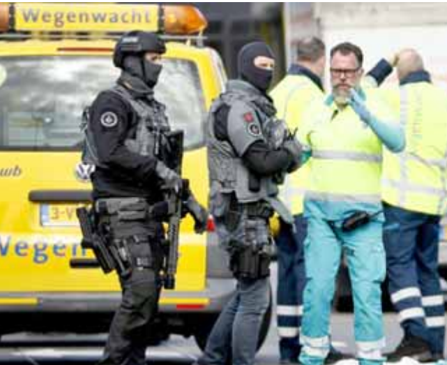
حادث: الشرطة وخدمات الطوارئ في مدينة أوترخت الهولندية بعد حادث إطلاق النار

وقال نحن لم نبدا او نتسحب بهذه الكارثة وقد فهموا ذلك ونسحب. وعن اجتماع منظمة التعاون الإسلامي المرتقب في استانبول قال بيترز "هذا الحدث المهم سيسهم لنيوزيلندا بالانضمام إلى شركائنا في التصدي للإرهاب والخطاف عن قيم مثل التفاهم والتسامح الديني". وقال موقفاً واضحاً جد بان الهجوم الإرهابي في كرايست تشيرش الذي ارتكبه شخص ليس نيوزيلندياً، نقض تام لقيمتنا الجوهريه.