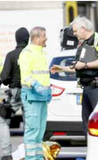
حادث: الشرطة وخدمات الطوارئ في مدينة أوترخت الهولندية بعد حادث إطلاق النار