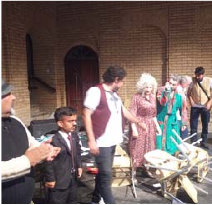
مسرح المحافظات : صالة منتدى المسرح تصيف مسرحية (الكراسي)