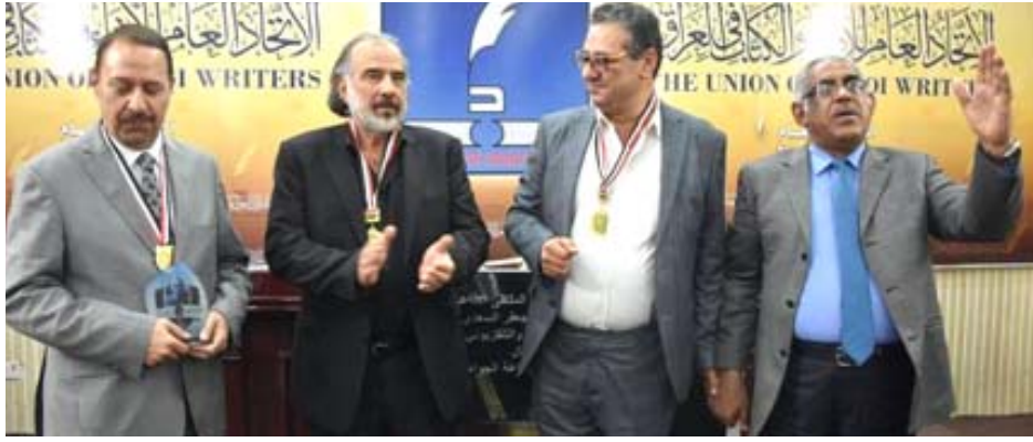
نجوم الدراما: الملتقى الإذاعي والتلفزيوني يحتفي بعلي جعفر السعدي ويكرمه مع حسن حسني وحامد المالكي