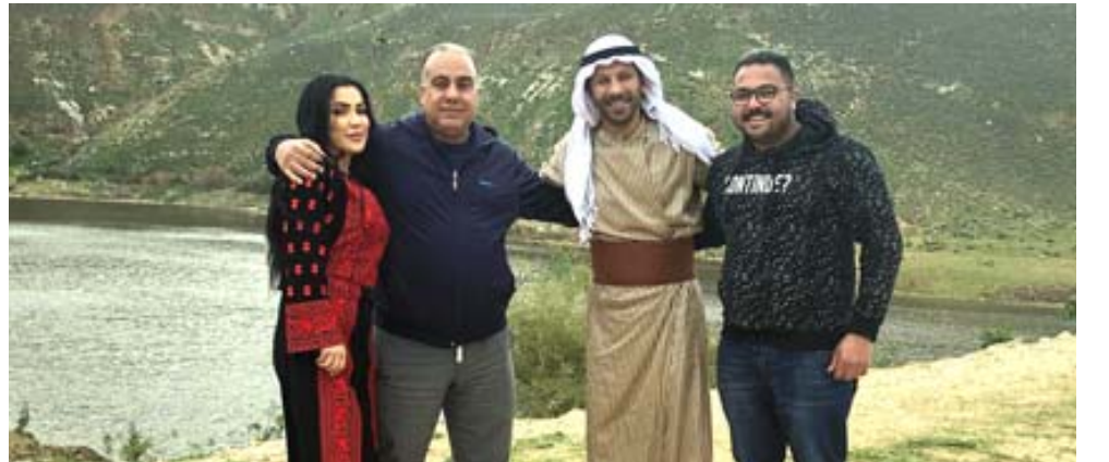
كواليس تصوير مسلسل (الخوابي)

عنان - رند الهاشمي تسعى الدراما الأردنية الى تقديم عمل فني جديد يحمل اسم مسلسل (الخوابي) يشترك فيه نجوم اردنيون وعرب ويتم تصويره حاليا بوقال حجاوي لوكالة الأنباء