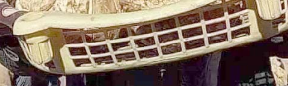
مواطن من الانبار يحملان قطعاً قياسية من كماً الصراة

مخاوف نيابية من تداعيات إجتماعية وسياسية وخير لـ (الزمان) : التعديلات على قانون الجنسية العراقية منافية للواقع والسائد دولياً