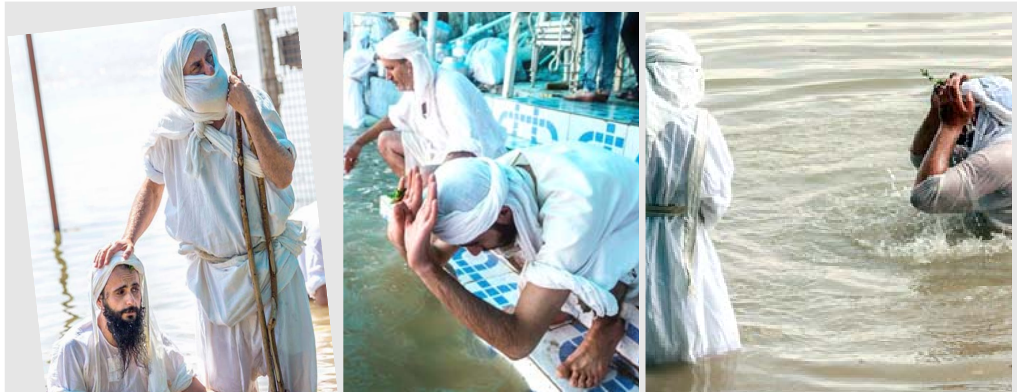
عيد الخليفة البرونايا

يحفل الصابئة المندائيون بعيد الخليفة البرونايا الذي يستمر خمسة أيام حيث تقيم العائلات المندائية هذه الطقوس قرب نهر دجلة كما تتم الصلاة والتعميد في الصباح بالماء الجاري وتذبح الذبائح وتقدم للمحتاجين.