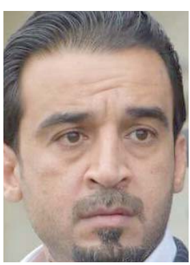
طهران - زرقاق نامقي

بدأ رئيس مجلس النواب محمد الطلوسي أمس الأربعاء زيارة إلى طهران هي الأولى له منذ تسلمه منصبه. والتقى الطلوسي برفاقه وفد نوابي الآمين العام لمجلس الأعلى للأمن القومي الإيراني على شمخاني وناقشا آخر التطورات الأمنية والسياسية في المنطقة، وتنسيق الجهود في مكافحة الإرهاب، والحد من الفسك المتهرب، وأكد الطلوسي خلال اللقاء بحسب بيان لخطته أن النصر تحقق بدماء العراقيين ودعم الدول الصديقة، ولا بد من الحفاظ على الاستقرار من خلال الدعم في مجالي الأمن وإعادة الإعمار، مؤكداً رفض الاعتداء على دول الجوار، من جانبها أكد شمخاني (دعم بلاده للعراق في مجال الأمن والاقتصاد)، التعاون في المجال الاقتصادي، مشيراً إلى أن الزيارات المتبادلة بين البلدين لها دور في تقوية أواصر العلاقة الثنائية والتعاون بين البلدين، وأضاف (إننا اليوم نرى العراق أفضل ما كان عليه سابقاً، وهو موحد بعيداً عن الخلافات الطائفية والقومية التي كانت تشتت الشارع العراقي)، إلى ذلك اجتمع الطلوسي مع رئيس مجلس الشورى الإيراني على ليرنجاني وعقد مؤتمر صحفياً عقب اللقاء، وبيّن الطلوسي إيران تلبية لدعوة رسمية من ليرنجاني يلتقي خلالها أيضاً الرئيس الإيراني حسن روحاني وعضو من المسؤولين الإيرانيين، وكان الطلوسي قد التقى الإيرانيين، وكان الطلوسي قد التقى