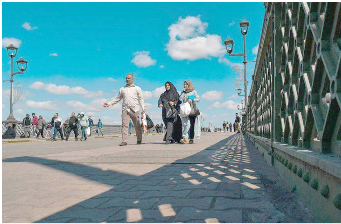
جسر : عوائل بغدادية تعبر جسر الشهداء في نهار شمس

القول (علينا ان نكون حذرين عند التعامل مع مثل هذه القضية رغم ملاحظتنا على مصادر معلومات هذه المنظمات من خلال خبرتنا في العمل سنوات طويلة بهذا الملف)، من دون ان يستبعد وجود جنبه سياسية في الموضوع، واصلت هيومن رايتس ووتش في تقرير امس الأربعاء ان السلطات العراقية تحاكم الأطفال المشتبه في صلتهم بداعش، وفق الية تشوبها (عيوب كثيرة)، مستخدمة اتهامات و اعترافات حصلت عليها تحت التعذيب، ويستند التقرير الشامل الذي أعدته المنظمة الحقوقية إلى مقابلات مع 29 طفلاً عراقياً، من الجنين والحاليين أو السابقين لدى الحكومة الاتحادية وحكومة إقليم كردستان، إضافة إلى أقارب وحراس سجون ومصانير الحذر ولأسماهم نحن أمام تنظيم خطر جدا جند الألاف، لافتا إلى ان (الجزء اعاد القانون حرية على اطفال، بينهم اجانب، وما جاء في تقرير المنظمة ان استغلال الأطفال ايش استغلال في عمليات عسكرية وحملات عسكرية، وقامت بغسل ادمغتهم الأمر الذي يجعلهم اجهزة وزارة الداخلية حريصة على اتباع الطرق السلمية عند التحقيق مع هؤلاء الأطفال ومن ذلك عرضهم على لفضاء مختصين علما ان أقصى عقوبة للمدان الحد لا تتجاوز السجن 15 سنة اذا لم يكن يبلغ الـ 18 سنة عند ارتكابه الجريمة كما ان هناك رعاية ومتابعة داخل المدارس الاصلاحية وكذلك هناك رعاية لاحقة بعد خروجهم من الاصلاحية).