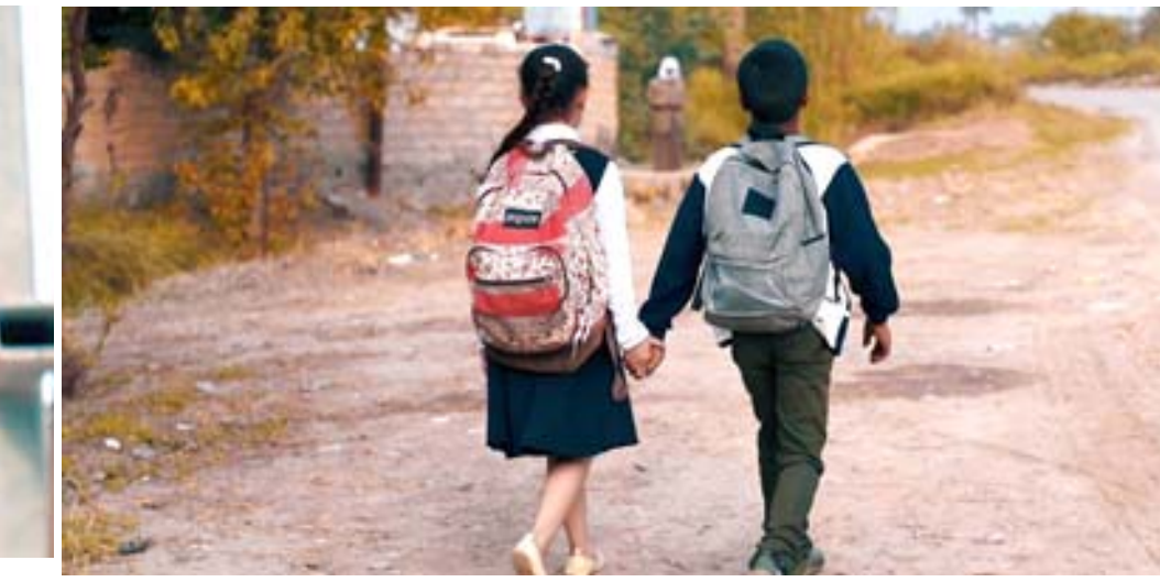
كواليس تصوير فيلم (حسجة)

الميزان ما حملت به بدأ يتحقق، فالشريك يبدي رغبة في مساعدتك، يوم السعد الاثني. العقرب تكون حاسماً في قرارات مصيرية ولا تصرح بوعود قد لا يكون بوسعك الوفاء بها. القوس قد تنفعل بسبب بعض الأوضاع الشخصية أو المهنية، ما يؤثر بعصبيتك ويشتك. الجدي تحتاج إلى وسيلة مختلفة للاستمتاع بوقتك، حدد قواعد تعينك على إنجاز مهامك. الدلو المشروعات الصغيرة قد تاتيك بريح لم تكن تتوقعه، تواصل مع الآخرين. الحوت لا تخجل من مفاتحة أصدقائك من أهل الثقة في ادق مشكلاتك، رقم الحظ 7. الحمل تبدو الأمور متشابكة، تواجه العلاقة المتارجحة ضعيفاً ومصاب. الثور مارس أقصى جهدك للبقاء قرب الحبيب أطول وقت ممكن. رقم الحظ 8. الجوزاء حذار المتاعب الصحية واحرص على سلامة المنزل والعائلة. رقم الحظ 3. السرطان انتعاش نحو مرحلة جديدة، وقد تكون معرّضاً لانتقاد أو لبيض الحاسبة والسائلة. الاسد مشروع زواج يخبئ أو يخس مفرين، يرغب من الكانة الاجتماعية والمادية لعائلتك. العذراء القلق المتواصل الذي يتناكب سببه نفسي بالدرجة الأولى والإرهاق المتواصل.