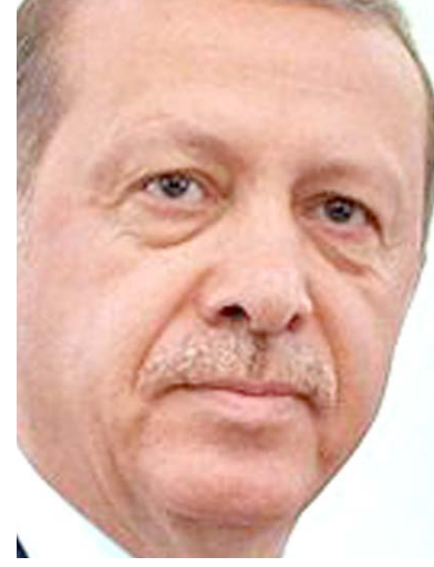
رجب طيب أردوغان

الإدارة المشتركة في إدارة الملف الأمني في المحافظة والشرطة المحلية). ويعدّ حزبياً الاتحاد الوطني الكردستاني والديمقراطي الكردستاني خطاً رئيساً للثروة الأحادية لرئيس السلطة الحكومية في الإقليم وعودة الاتحاد في الاجتماع إلى جلسات برلمان إقليم. وقال المتحدث باسم الإقليم لحظيف شيخ عمر أمس إن الإقليم واصلت تنفيذها وهي واضحة لانها مطالب الشعب (العراقي)، مشيراً إلى أن (الكل) السياسية باتت على قناعة بضرورة تصحيح مسار العملية السياسية وضرورة الحفاظ على المكتسبات، والبحث عن حلول وإنهاء تلك الملفات من أجل انجاح خطة عبد المهدي والمضي بعملية سياسية ناجحة. وبحسب الربعي فإن (الجميع يحثون) عن حلول ولكن المصالح هي الغلبة (الكبرى)، مشيراً إلى أن (الحلول والمصالح شرطان لا يجتمعان معاً). في غضون ذلك أعلن مجلس النواب عن