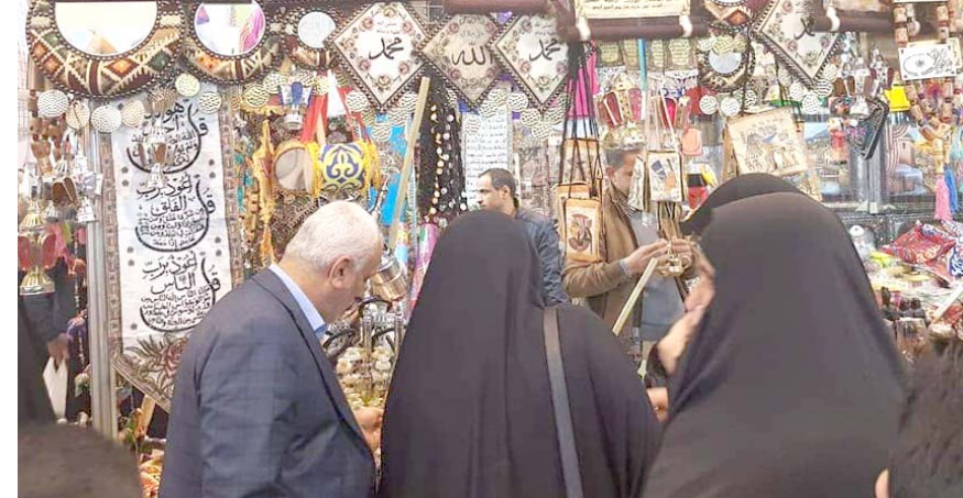
عرض منتجات الشركات المصرية تعرض في محافظة النجف

الاعمال العراقي، وغيرها من الاتحادات المعنية). وأشار نوري إلى أن (عملية إعادة إعمار العراق خلال السنوات المقبلة تحتاج 88مليار دولار).