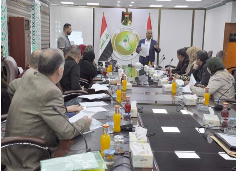
دورات ، ومنتسب وزارة الزراعة خلال دورة تطويرية في نينوى