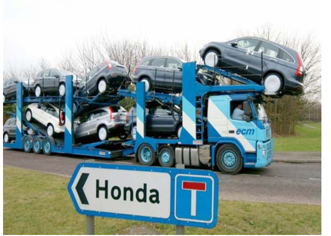
مصنع: شاحنة تنقل سيارات من مصنع هوندا في سويدون بريطانيا

الذين سيقوهمون السببت 'ضمن قوافل' إلى الحدود . وحدد غواويد موعداً لمناصريه لنقل المساعدات الإنسانية المكتسبة في دول الجوار . ووعد بان المساعدات ستدخل البلاد في هذا التاريخ 'مهما حصل' حتى لو كلف ذلك اختيار قوة مع الجيش الفنزويلي الموالي لمادورو . وتتكسك مواد غذائية وأدوية أرسلتها الولايات المتحدة لتلبية لنداء غواويد في كولومبيا منذ الأسابيع من شباط/فبراير، لكن حوايات وضعتها سلطات كراكاس على الجسر الحدودي تحول دون إدخالها . ومع اقتراب استئناف السببت، دعا غواويد اليئراس البرلمان المعارض، الجيش إلى عدم عرقلة دخول المساعدات . ومساءلة دخول المساعدات حساسة في البلاد التي تشهد أسوأ أزمة اقتصادية في تاريخها المعاصر مع توجه حد في الأدوية والأغذية . ووجه الرئيس الأميركي دونالد ترامب الاثنين تحذيراً شديد الحفاة للعسكريين الفنزويليين بانهم قد 'يخسرون كل شيء' في حال رفضوا وقف المعارض خون غواويد الذي أعلن نفسه رئيساً بالوكالة . وقال ترامب في خطاب القاه في ميامي أمام الجالية الفنزويلية في فلوريدا 'أنتظر العالم بأسره مسطرة عليكم اليوم داعياً الضباط الفنزويليين الذين لا يزالون مواليين للرئيس نيكولاس مادورو إلى السماح بدخول المساعدات الإنسانية التي يبلادهم . وأضاف الرئيس الأميركي 'لا يمكنكم الاختفاء من الخبايا الذي يواجهكم، يمكنكم ان تختاروا قبول عرض الغفو السخي الذي قدمه الرئيس (بالوكالة) غواويد والعيش بسلام مع عائلاتكم ومواطنيكم . وتابع ترامب 'أو يمكنكم