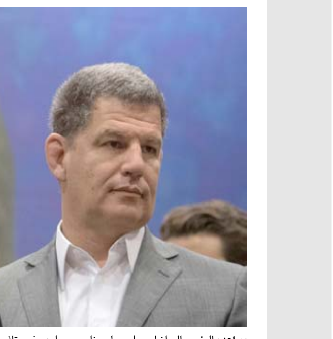
مساعد، الرئيس البرازيلي جابر بولسونارو ومساعد غوستافو بيبياينو في ريو دي جانيرو

وكبرشتر متهمة في القضية التي أرجأت جلساتها الانتقائية إلى أيار/مايو بحسابة لجل الأعمال لأزور بايز في أحالة عقود عامة بقيمة 45 مليار يورو (2.1 مليار دولار) خلال ولايتها الرئاسية بين عامي 2007 و2015. من المقرر أن تمثل الرئيسة السابقة الإثنين المقبل قاضي التحقيق كلاويو بونابديو لإبلاغها في قضية فضيحة 'دفاتر الفساد' الشهمة فيها بتلقى رشاي بعشرات ملايين الدولارات. وتقول كبرشتر العضو في مجلس الشيوخ الأرجنطيني والتي تتخضع بحصانة برلمانية جزئية، إنها مقلبة أحد قضاة المحكمة. ويقع بايز وغيره من المسؤولين قيد التحقيق الاحتيالي بانتظار بدء المحاكمة. وكانت النيابة العامة أمرت بوضع كبرشتر رهن التوقيف الاحتياطي في قضية برلمانية جزئية، لكن حصانيتها البرلمانية قضيتها السجن وليس المحاكمة. وكانت فضيحة 'دفاتر الفساد' كشفت في الأول من آب/أغسطس بعد نشر مضمون دفاتر دون فيها سائق أحد المسؤولين بدرجة أمانك وتواريخ تسليم أكياس من المال إلى أعضاء في إدارة كبرشتر، من رؤساء شركات في قطاع الأشغال العامة. وبحسب المدعي العام كارلوس ستورنيلي، تصل قيمة الرشاي بين عامي 2005 و2015 إلى 160 مليون دولار. في الإتهام أمرت السلطات بتوقيف النائب السابق لكبرشتر أمادو بودو. وفي آب/أغسطس الماضي حكم على بودو بالحبس لنحو ست سنوات لإرثائه بالفساد وبخلافه وإجباته العامة، لكن المحكمة أطلقت سراحه بكفالة في كانون الأول/ديسمبر. وقد دين بودو في قضية محاولته شراء شركة لطباعة العملة بواسطة شركة وهمية خلال توليه حقيبة الاقتصاد في عهد كبرشتر. لكن سلطات مكافحة الفساد طعنت بقرار تغلبته بكفالة وقد قبلت غرفة التمييز الفرديّة الطعن معتبرة أن إطلاق سراحه يشكل خطرا على سير المحاكمة.