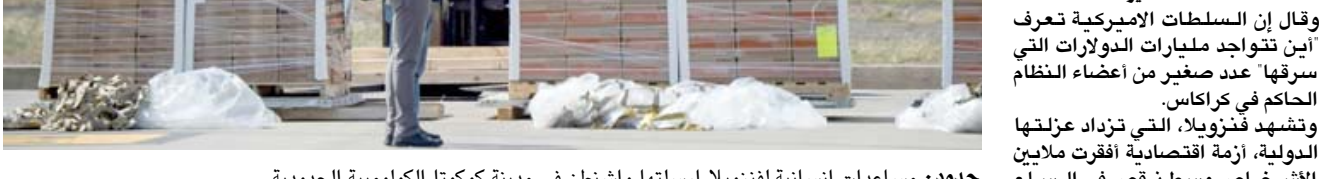
هجوم: مساعدات انسانية لفنزويلا ارسلتها واشنطن في مدينة كوكوتا الكولومبية الحدودية

وقال إن السلطات الأميركية تعرف أين تتواجد مليارات الدولارات التي سرقتها عدد صغير من أعضاء النظام الحاكم في كراكاس. وتشهد فنزويلا، التي تزدهر عزلتها الدولية، أزمة اقتصادية أقرت ملايين الأشخاص وسط نقص في السلع الأساسية مثل الغذاء والدواء. لكن مادورو يبقى وجود حالة 'طوارئ' إنسانية، ويحصل مسؤولي النقص الغذائي للمقوبات الأميركية التي تقول كراكاس إنها تفقد الاقتصاد الفنزويلي 30مليار دولار في العام. رغم الإعلان أنه يفضل 'انتقالاً سلمياً' في فنزويلا، قال الرئيس الأميركي إن عشرات المهن الاسريكية في احتجاجات الاثني خلال عطلة (يوم الرؤساء) ضد إعلان ترامب حالة الطوارئ ضد إعلان حالة الطوارئ المهاجرين' 'وأعلن ترامب حالة الطوارئ يوم الجمعة بموجب قانون يرجع لعام 1976 أبعاد عن رفض الكونجرس الاستجابة لطلبه بخصوص 7.5مليار دولار للمساعدة في بناء الجدار الذي كان التمسيد الأساسي في حملته الانتخابية عام 2016. ويهدف الإعلان إلى تمكينه من الحصول على التمويل من مخصصات قررها الكونجرس بالفعل لمشروعات