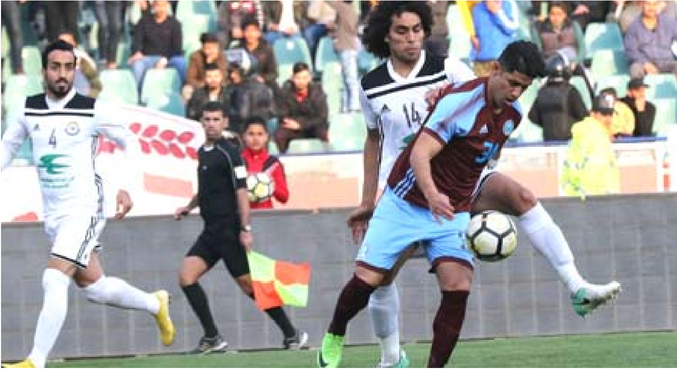
تغييرات: شهدت مباريات الدور 17 لدوري الكرة تغييرات في سلم ترتيب الفرق