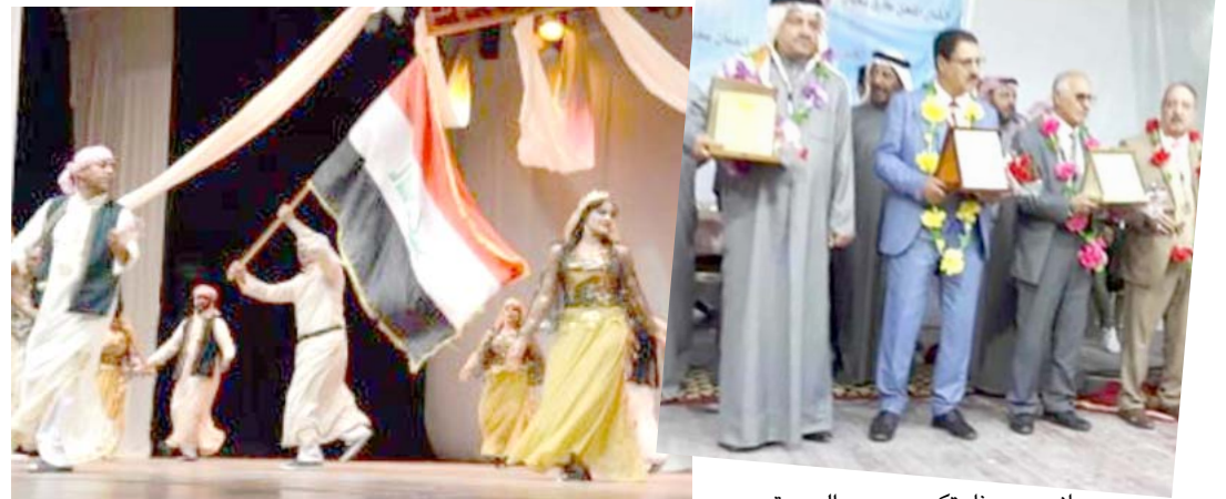
جانب من حفل تكريم مبدعي البصرة