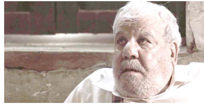
عمل متميز: فيلم (بندقية الشرق) يتفوق في مهرجان اربيل السينمائي