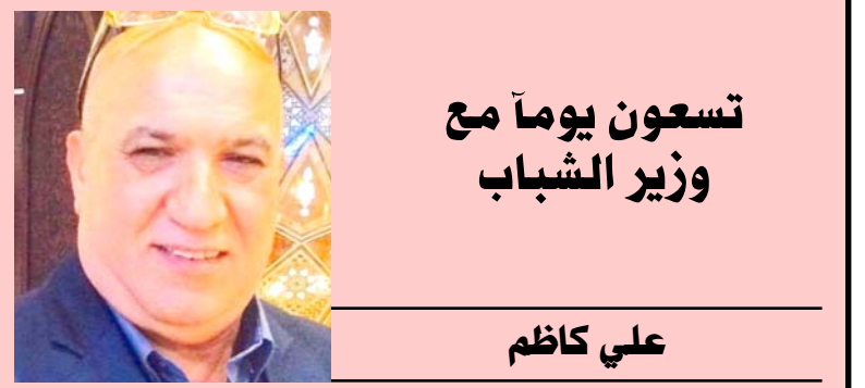
تسعون يوماً مع وزير الشباب