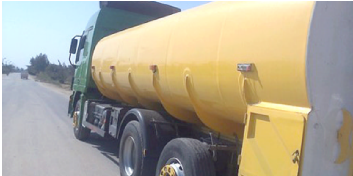
خام : صهاريج تحمل خاماً على طريق شمال العراق

صاحبه، مع ضبط دفتر النمة الخاص بالصوك البالغ عددها 16 صكاً مع تنظيم محضر ضبط اصولي بالميرزات المصنوعة مع الأوليات، وعرضها بصحبة المتهم على قاضي التحقيق المختص؛ الذي قرر إيقافه وفقاً لأحكام المادة 340 من قانون العقوبات، وإصدار قرارات استقدام قبض بحق كل من له علاقة بعملية الاختلاس، موضحة أن قيمة أحد الصوك بلغت 350 مليون دينار، وبحسب البيان فقد تمكن فريق من مكتب تحقيق صلاح الدين من ضبط خمسة متهمين، بينهم مدير محطة وقود في المحافظة، لقيامهم باختلاس مبالغ الوفود التي تدفع عبر قيامهم بالتابع بعددات كميات الوفود المباع للمواطنين، لافتاً إلى أن عمليتي الضبط تمتاً بموجب مذكرات ضبط قضائية.