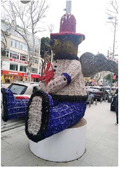
شارع بغداد وسط اسطنبول