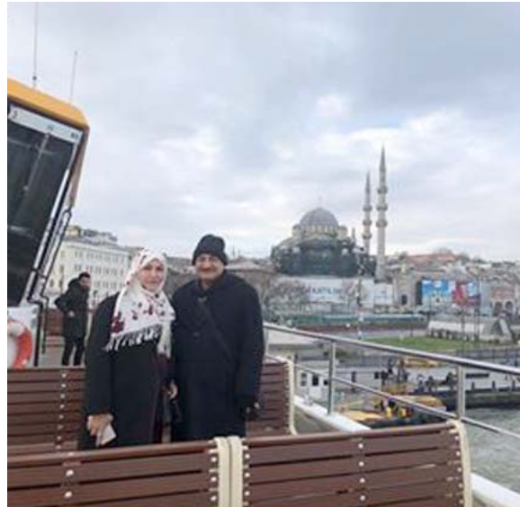
في العبارة للاتاقا الى الجانب الآسيوي من اسطنبول

اسطنبول - حمدي العطار استخدمت الدول الراسمالية مفهوم القوة الناعمة في الحرب الباردة ضد الشيوعية والدول الاشتراكية ويبدو انها نجحت في ذلك، واول ما دعا الى تبني القوة الناعمة جنبا الى جنب مع القوة العسكرية والاقتصادية هو (جوزيف شاي) ونصح الانظمة الى الابتعاد على التهديد او الابتزاز واللجوء الى (الاقناع) وحينما انهارت الشيوعية في الاتحاد السوفيتي والدول الاشتراكية حاولت (الصين) المحافظة على نظامها بالاستفادة من مفهوم القوة الناعمة، ونحن بعد 2003 تلمسنا مفعول القوة الناعمة التي تتمسك فيها تركيا لنشر نفوذها الاقليمي فكان الاهتمام