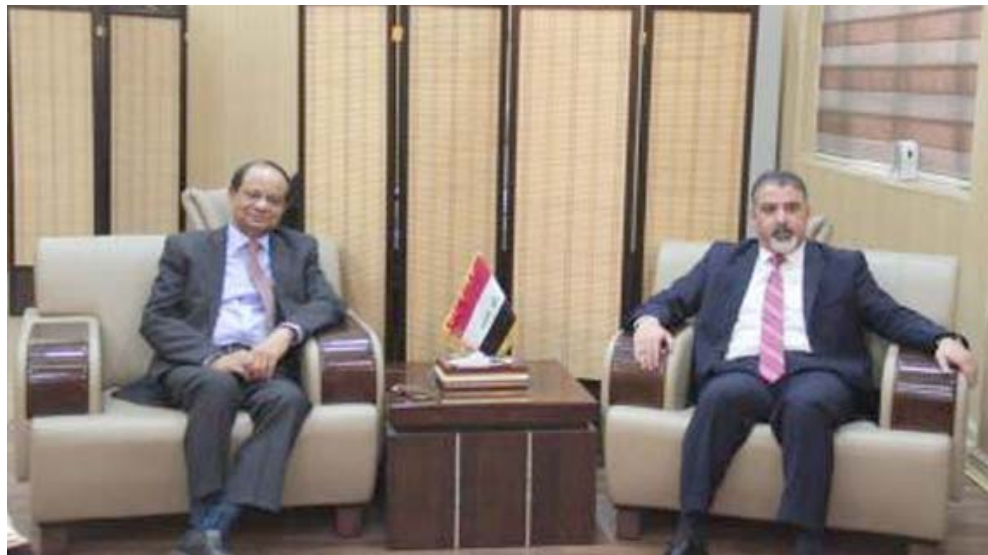
تظير: وزير العمل مع نظيره البنغلاديشي في بغداد

بغداد-الزمان اصدرت دائرة التقاعد والضمان الاجتماعي للعمال في وزارة العمل والشؤون الاجتماعية اكثر من الف هوية تقاعدية للعمال المضمونين خلال العام المنصرم وقال بيان للوزارة تلقته (الزمان) اس ان (الدائرة منحت الف و 486 قديدا لمعاملات عمال ممن بلغوا السن القانونية للتقاعد في العراق السابقين الى قسمي التقاعد والتعويضات وشؤون المضمونين لاكمال الاجراءات القانونية حيث تم اصدار اكثر من الف و500 هوية تقاعدية وتحديث 10 الاف و 564استمارة مغفريات خاصة بنقل الراتب التقاعدي فضلا عن ادخال وكالة او وصاية او تحرير درجة العجز او رمز الشرط للطالب)،واضاف ان ( قسم صرف الرواتب التقاعدية تولى مهام احوالة العمال المضمونين الذين لم يكملوا السن القانونية الى اللجان الطبية الابتدائية والاستثنائية لتحديد نسبة العجز لديهم وكذلك تسليم الرواتب الخاصة ببغداد والمحافظات الى مصرف الرافدين واستلام ايضا الرواتب المسترجة للعمال الذين لم يستلموا رواتبهم والتي بلغ عددها 3 الاف و336راتبا).