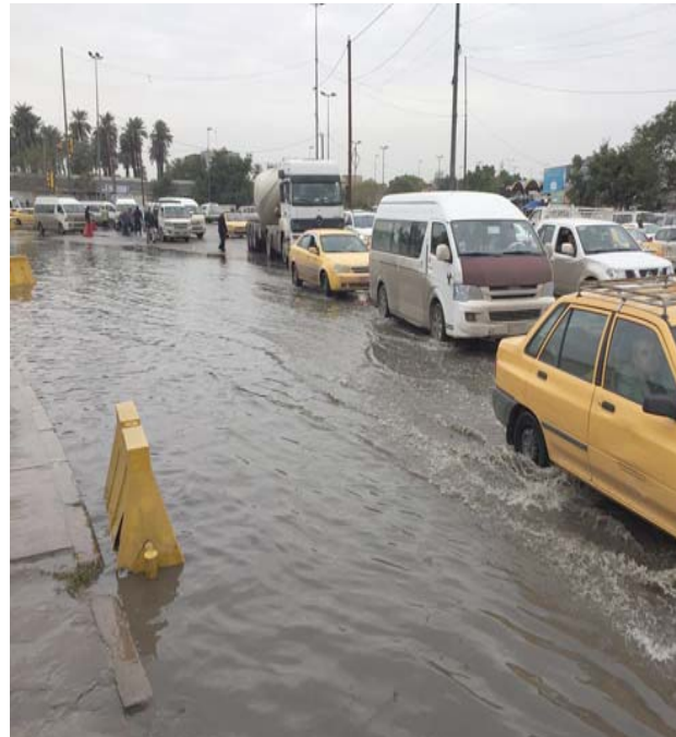
غرق: شوارع في بغداد اغرقتها مياه الامطار

وكشفت محافظة بغداد عن قرب افتتاح مشروع مجاري جسر ديبالى الاستراتيجي والذي انجز العمل فيه بشكل كامل وسيشهد الاسبوع المقبل افتتاحه ودخاله في الخدمة الفعلية.