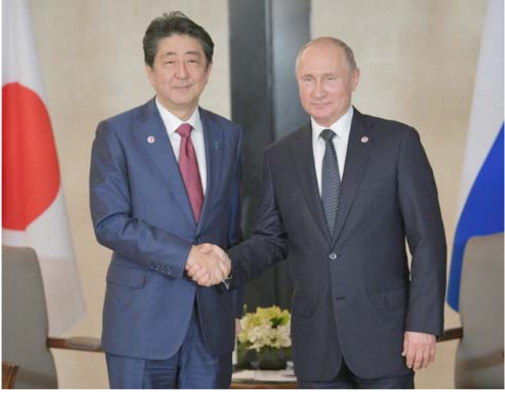
لقاء الرئيس الروسي فلاديمير بوتين بلقي رئيس وزراء اليابان شينزو آبي في سنغافورة

واقف أن السيادة على هذه الجزر مطروحة للنقاش. وقال أوتشوكوف في مستهل الأسبوع الماضي إنها أرضنا ولا أحد ينوي التخلي عنها لاي كان. ونكرت بييسكوف الإثنين أن توقيع مضمون الاتفاق بين بوتين و آبي والسعي لفرض السيناريو الخاص بها. وضم الاتحاد السوفياتي هذه الجزر البركانية الأربع المعروفة بـ"كورييل الجنوبية" في روسيا وأراضي الشمال في اليابان عند لفروف ما زلنا يعيدان عن وضع الشريكين ليس فقط على مستوى العلاقات الدولية، بل أيضا على مستوى العثور على سبل بناء لتحسين علاقتنا. وقبل يومين من القمة بين بوتين و آبي، تظاهر مئات الروس احتجاجا على أي احتمال بالتخلي عن الجزر المتنازع عليها لليابان وكان بوتين و آبي اتفقا في تشرين الثاني/نوفمبر في سنغافورة على تسريع المفاوضات استنادا إلى إعلان يعود إلى العام 1956 حيث صفا الحرب العالمية الثانية نهائيا وينص هذا الإعلان على أن الاتحاد السوفياتي يتعهد بإعادة أصغر جزيرتين (شيكوتان وهايوماي) لليابان لقاء توقيع معاهدة سلام. إلا أن المفاوضات لم تسفر عن أي نتيجة حتى الآن، وقد نبذت بشدة بعد توقيع اتفاقية تعاون بين طوكيو وواشنطن في 1960. وهذه الجزر الأربع الإستراتيجية لأحتوائها على معادن وفروة سمكية وتأمينها منفذ للبحرية الروسية على المحيط الهادئ، تقع عند الطرف الجنوبي لأرخيبيل الكوريل وهي بالثاني الأقرب إلى اليابان.