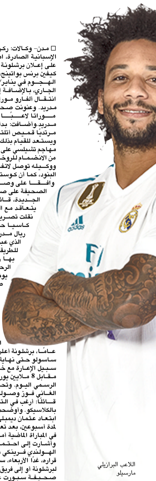
اللاعب البرازيلي مارسيلو

□ لندن- وكالات: أكد البلجيكي كينغ دي بروين، صانع ألعاب مانشستر سيتي، أنه واجه تحدياً عقلياً، بعد إصابته للمرة الثانية في ركبته هذا الموسم، وأكمل دي بروين أول 90 دقيقة مع مانشستر سيتي هذا الموسم في مباراة الفريق الأخيرة أمام هيدرسفيلد، بعد أن عانى لعدة أشهر من الإصابة، وقال دي بروين، في تصريحات أبرزتها صحيفة ديلي ميل البريطانية: كنت مصاباً لمدة 6 أشهر تقريباً، واعتقد أن المرة الثانية الإصابة كانت أكثر صعوبة من الناحية الفنية، وأضاف: كنت أقدم أداء جيداً حسبما اعتقدت، ثم سقط شخص ما على ركبتي وكان علي الخضوع لعملية أخرى، ولست معتاداً على اللعب كل 3 أيام في الوقت الحالي، وأحتاج لوقت من أجل الوصول إلى الإيقاع العالي، وتابع: اجتازت بيني عندما كنت في الـ 14 من عمري وكنت بحاجة إلى القيام بذلك ولقد جنيت الثمار، أنت لا تعرف كم كنت أصعب في ذلك الوقت، وأكمل: اضطررت لقطع مسافة 200 كيلومتر لرتبة والذي يوم السبت، ثم أعيد يوم الأحد، لا يمكنني تحمل الخسارة، حتى في اللعب أحاول دفع نفسي كي أكون أفضل، هذه عقوبة الفوز الخاصة بي، وأحياناً أنتزع كثيراً في الملعب، لكن هذه هي طريقتي وعلى الناس أن يتقبلوها.