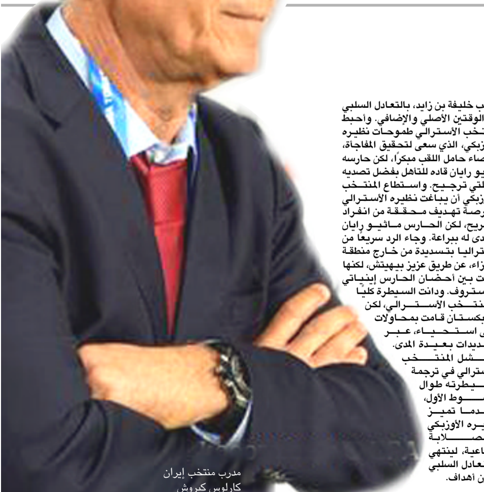
مدرب منتخب إيران كارولوس كيروش