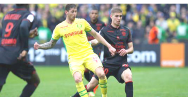
لقطة للاعب الأرجنتيني إميليانو سالا

□ باريس- وكالات: اختفت طائرة ركاب صغيرة متجهة من فرنسا إلى كاريف في المملكة المتحدة البريطانية، وكانت تقل على متنها لاعباً أرجنتينياً، وقالت صحيفة مونديو ديپورتفو الإسبانية، إن إشارات الرادار فقدت الاتصال مع طائرة ركاب كانت متجهة من فرنسا إلى بريطانيا، ونقل على متنها المهاجم الأرجنتيني إميليانو سالا، ووفقاً لما ذكرته صحيفة لو باريزيان الفرنسية، فإن هناك تحقيقات موسعة جارية منذ ساعات الخبر، بعد أن اختفت الطائرة بشكل مفاجئ ولم يعرف مكانها حتى الآن، وأطلقت الطائرة من مطار نانت متجهة إلى كاريف، وكانت تحمل على متنها اللاعب الأرجنتيني سالا، الذي