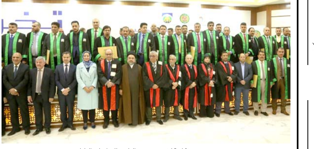
صورة تذكارية لخريجي معهد العلمين للدراسات العليا

الساهل ناقش خلال تروسه اجتماعا ضم عمداه كليات الطب (الطلبة) وأضاف أن التعليم يضع ضمن ستراتيجهاته المستقبلية تفعيل عوامل استقطاب الطلبة الأجانب للدراسة في الجامعات العراقية فضلا عن توسعة خطة القبول في الدراسات العليا للتخصصات الطبية.