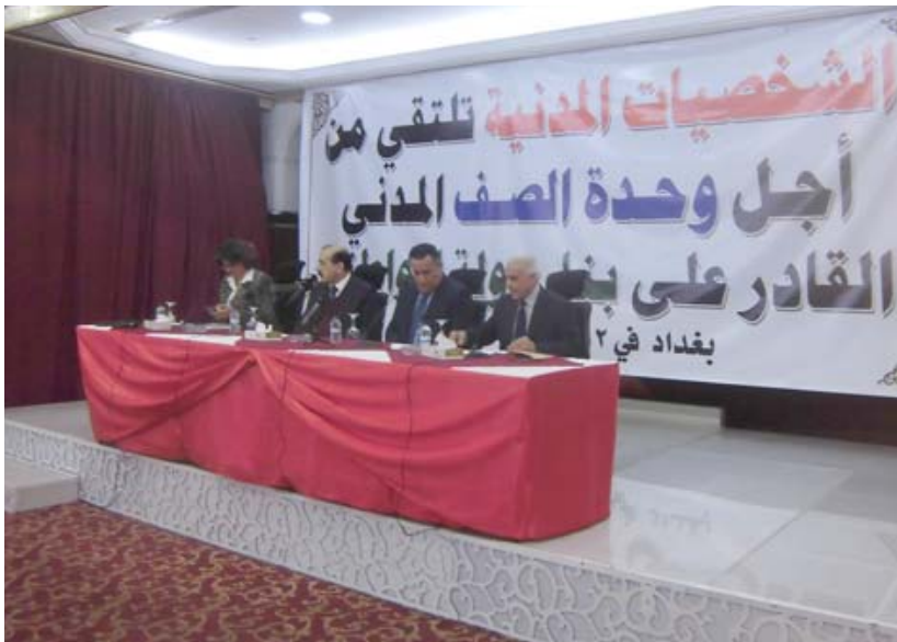
جانب من اجتماع القوى المدنية الوطنية الذي عقد في بغداد