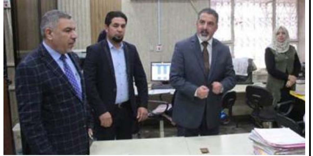
تفقد وزير العمل ووكيله خلال تفقدتهما قسم الحماية الاجتماعية في مدينة الصدر

وتابع قسم السلامة في المركز الوطني للصحة والسلامة المهنية في الوزارة تقارير سلامة الخسطة انهم فوق مستوى خط الفقر و126 حالة مواطنين بانتظار