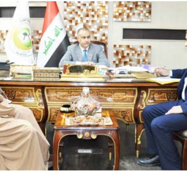
وفد وزير الزراعة خلال لقائه وفد محافظة ميسان

تناولت الندوة مواضيع عدة كان أهمها الخطر التي اهم الأمراض المعدية التي تسبب هلاكات كبيرة في الجاموس وطرق الوقاية منها . و أسباب انتشار الأمراض الوبائية و كيفية الحد منها، وامكان إيواء الحيوانات الجيدة و الاعلاف المركزة و دورها في الحد من الإصابة بالأمراض التي تصيب الجاموس، و تناولت الندوة أيضا شرحا مفصلا حول كيفية اعطاء الاعلاف و اللقاحات ضد الأمراض الوبائية و الإرشادات الصحية المهمة للوقاية).