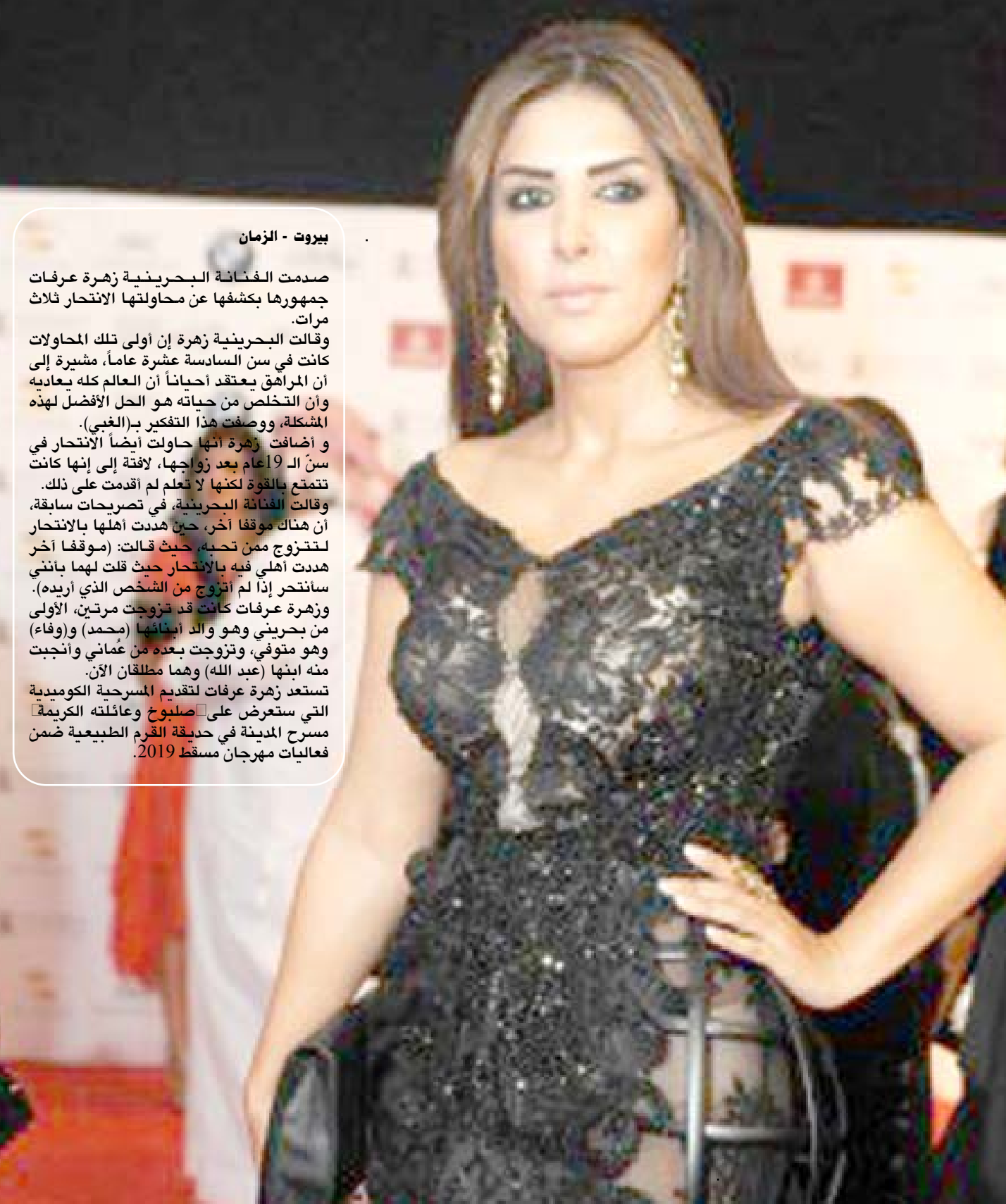
بيروت - الزمان صدمت الفنانة البحرينية زهرة عرفات جمهورها بكشفها عن محاولتها الإنتحار ثلاث مرات.

وقالت البحرينية زهرة إن أولى تلك المحاولات كانت في سن السادسة عشرة عاماً، مشيرة إلى أن المراهق يعتقد أحياناً أن العالم كله يعاينها وأن التخلص من حياته هو الحل الأفضل لهذه المشكلة، ووصفت هذا التفكير بـ(الغبى). وأضافت زهرة أنها حاولت أيضاً الإنتحار في سن الـ19 عاماً بعد زواجها، لافتة إلى أنها كانت تتمتع بالقوة لكنها لا تعلم لم أقدمت على ذلك. وقالت الفنانة البحرينية، في تصريحات سابقة، إن هناك موقفاً آخر، حين هدت أهلها بالإنتحار لتتزوج ممن تحبه، حيث قالت: (موقفاً آخر هدت أهلي فيه بالإنتحار حيث قلت لهما بانتي سانتحر إذا لم أتزوج من الشخص الذي أريده). وزهره عرفات كانت قد تزوجت مرتين، الأولى من بحريني وهو والد أبنائها (محمد) و(وفاء) وهو متوفي، وتزوجت بعده من عماني وأنجبت منه ابنتها (عبد الله) وهما مطلقان الآن. تستعد زهرة عرفات لتقديم المسرحية الكوميدية التي ستعرض على صليبخ وعائلته الكريمة مسرح المدينة في حديقة القرم الطبيعية ضمن فعاليات مهرجان مسقط 2019.