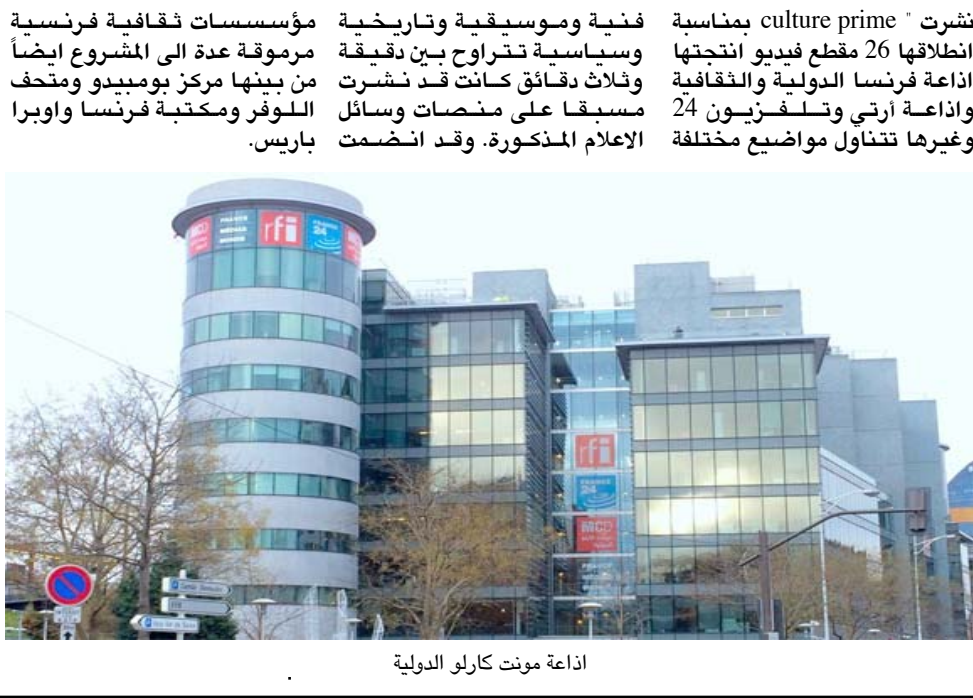
اذاعة مونت كارلو الدولية