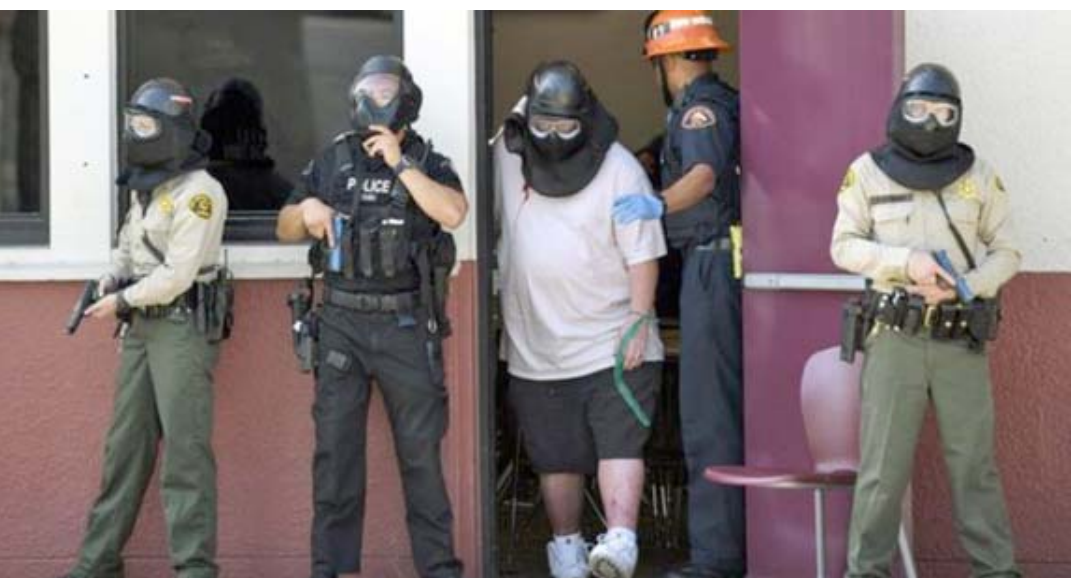
استعداد: تدريب في مدرسة لوس أنجلس يستهدف التاكيد من الاستعداد في حالة وقوع هجمات

تتضمن حوادث إطلاق النار قاتمة من المراهقين والأسلحة النارية والضحايا الأبرياء، مرتكبوا الحوادث صغار في السن حيث يمكن أن يكونوا حتى في الثانية عشرة إلا طالبين آخرين ولاحقاً عندما جوبه بالأسلحة قتل نفسه، أحد الجرحين كان طالبة في السادسة عشر وقد توفيت بعد أيام متأثرة بجراحها. اسلحة نارية تتضمن حوادث إطلاق النار قاتمة من المراهقين والأسلحة النارية والضحايا الأبرياء، مرتكبوا الحوادث صغار في السن حيث يمكن أن يكونوا حتى في الثانية عشرة إلا طالبين آخرين ولاحقاً عندما جوبه بالأسلحة قتل نفسه، أحد الجرحين كان طالبة في السادسة عشر وقد توفيت بعد أيام متأثرة بجراحها. اسلحة نارية تتضمن حوادث إطلاق النار قاتمة من المراهقين والأسلحة النارية والضحايا الأبرياء، مرتكبوا الحوادث صغار في السن حيث يمكن أن يكونوا حتى في الثانية عشرة إلا طالبين آخرين ولاحقاً عندما جوبه بالأسلحة قتل نفسه، أحد الجرحين كان طالبة في السادسة عشر وقد توفيت بعد أيام متأثرة بجراحها. اسلحة نارية تتضمن حوادث إطلاق النار قاتمة من المراهقين والأسلحة النارية والضحايا الأبرياء، مرتكبوا الحوادث صغار في السن حيث يمكن أن يكونوا حتى في الثانية عشرة إلا طالبين آخرين ولاحقاً عندما جوبه بالأسلحة قتل نفسه، أحد الجرحين كان طالبة في السادسة عشر وقد توفيت بعد أيام متأثرة بجراحها. اسلحة نارية