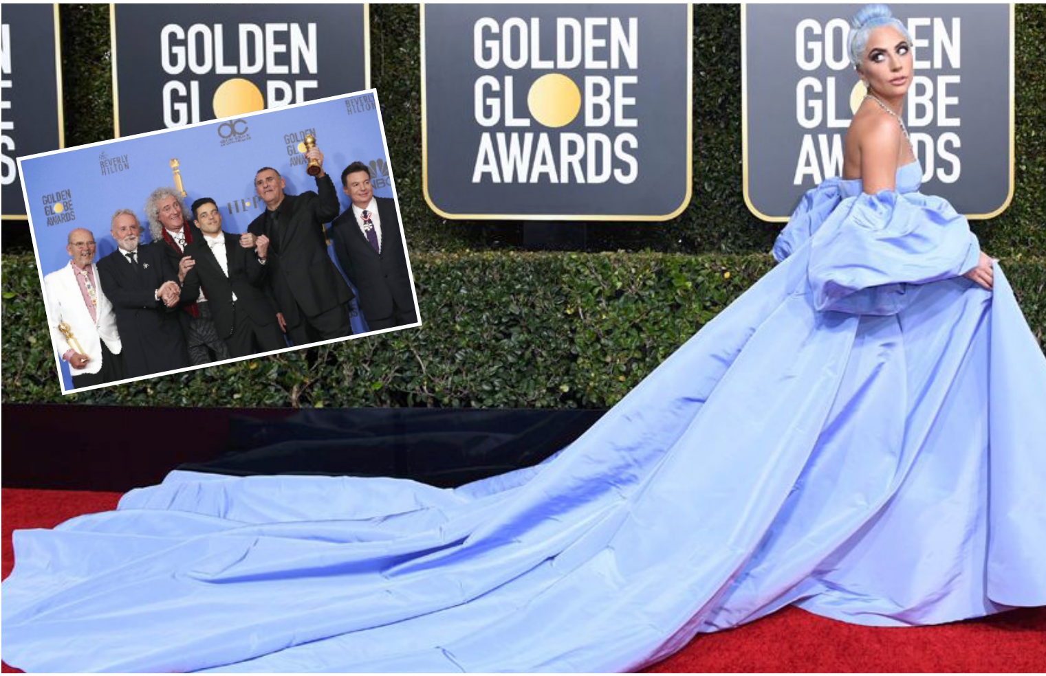
بساط: ليدى غاغا على السجادة الحمراء في كولدن كلوب