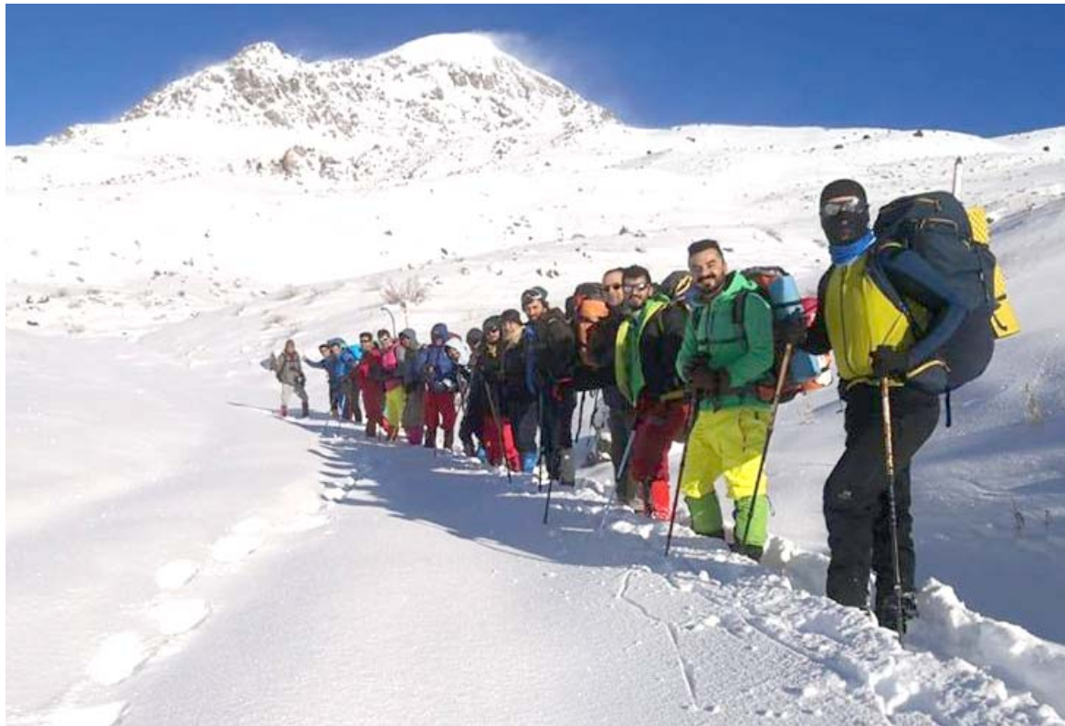
رحلة : شبان من مناطق عراقية خلال رحلة تسلق جبال في اربيل مغطاة بالثلوج