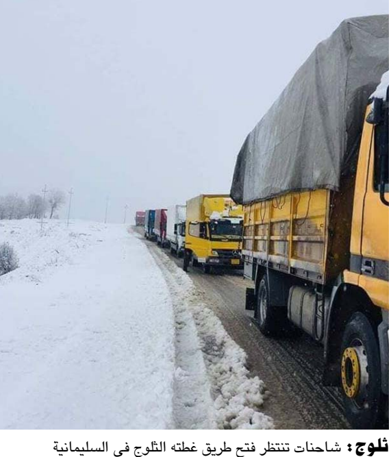
تلوج : شاحنات تنتظر فتح طريق غلته الثلوج في السليمانية