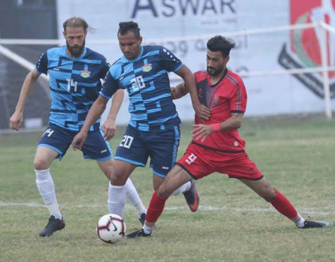
مواجهات ، تتواصل عجلة الدوري بالوردان وسط طموحات الفرق لتحقيق الفوز

التفوق عليه لكن من خلال الأداء القوي من لاعبي البحري للخروج من دوامة نتائج التعادلات ولأن ميسان لا يمكنه مواصلة الصمود على نتائج ملعبه إذا ما اجتهد لاعبو البحري وعكس رغبة الفوز. الوسط والكهرباء ويحاول الوسط العودة لعزز نغمة الفوز التي غادرها منذ ستة اوار قبل ان يتلقى خسارتي الزوراء ونفط الجنوب عندما يحل ضيفاً على الكهرباء الذي لم ينجح بإيقاف نتائج الهزيمة ولم يتمكن عباس عطية من تغير الوضع المخيف ما ابقى الفريق في الوضع السلسلي ولأنه اقتعد للحلول من بعيد او قريب وبقي يعاني بعد خسارة ستة مباريات أي نصف ما لعبه لآن ولم يقدم ما يعكس رغبة العودة للمنافسات فقد إلى الموقع الاخير المرشح للهبوط وبعد مروراً 2 جولة لم يقدم أي شيء فقد الفوز على الكهرباء الذي لم يخرج عن خاتمة المفاجأة التي اعتاد يواجه مشاكل المباريات التي اخذت منه الكثير وجعلته يراوح بين مكانه ومرشح للهزيمة السابعة 17 الوسطي في مهمة صعبة ويضم مجموعة لاعبين قادرين على تقديم المستوى العالي والوصول الى الحلول والعودة للتحقق بكامل الامتياز كما ان الوسط قادر على السيطرة التي يفقد لها الكهرباء وتحقق النجاح المنتظر الذي يبحث عنه امام فرصة واثابية في ظل الاجتهاد والتراجع الذي عليه الكهرباء.