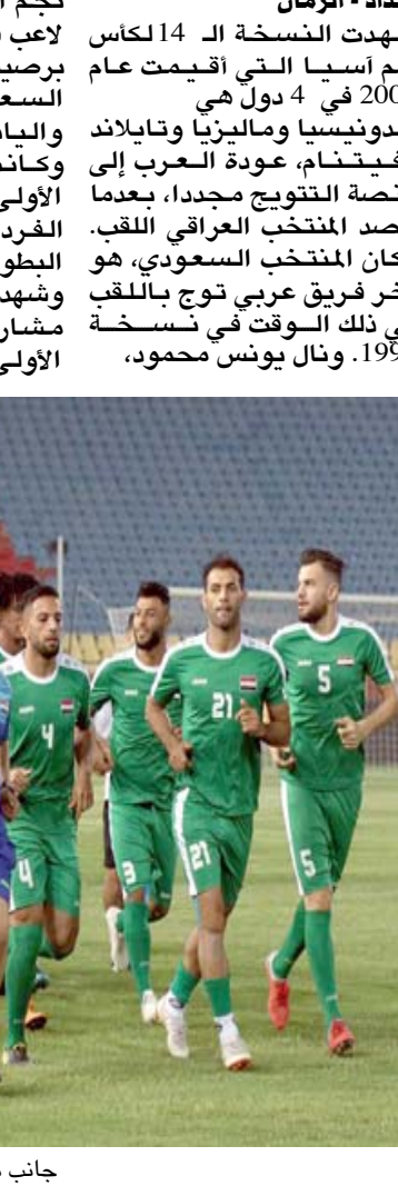
جانب من تدريبات المنتخب بكرة القدم

بغداد - الزمان شهدت النسخة الـ 14 لكأس أمم آسيا التي اقيمت عام 2007 في 4 دول هي إندونيسيا وماليزيا وتاييلاند وفيتنام، عودة العرب إلى منصة التتويج مجددًا، بعدما حصد المنتخب العراقي اللقب. وكان المنتخب السعودي، هو آخر فريق عربي توج باللقب وذلك في نسخة 1996، ونال يونس محمود، نجم العراق جائزة أفضل لاعب في البطولة، وهدافها برصيد 4اهداف متساوية مع السعودى باسر القحطاني والياباني ناوهير تاكا هارا. وكانت هذه هي النسخة الأولى التي تقام في الأعوام الفريدة حتى لا تتعارض مع البطولات الكبرى الأخرى. وشهدت تصفيات تلك النسخة مشاركة حامل اللقب للمرة الأولى بعدما تأهلت 4