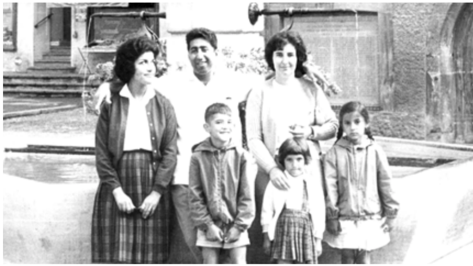
فيلم متميز: صورة وثائقية ضمن فيلم (الأوديسة العراقية) (الزمان)