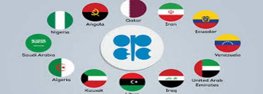
مخطط يوضح سقف الانتاج في اوبك