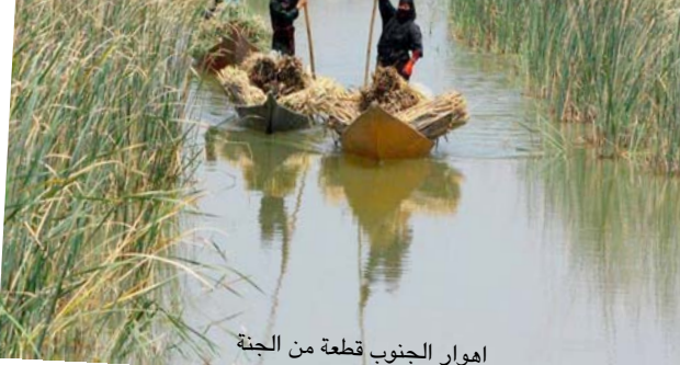
اهوار الجنوب قطعة من الجنة

وتواصلنا مع ما نتعده جملاً مستخفاً بنسبي إلى إظهاره واكتشافه لا يتم إلا عبر القراءة والسماع والكتابة وهذا يحتاج منا إلى العوم في اخبلة التصور المتناسدة كما يفعلها اصحاب الطرائق والمصوفون وخصوصاً ايام الخريف والشتاء حيث تقاسمك ذات المشاعر تلك المشاهد الطائرة في سماء ذلك التامل عندما تاوي إلى المكان طيور معددة الأنواع قادمة من سيبيريا ومن البلطيق وكندا والصين، وكذا عندما تستهني لحم احد هذه الطيور، نخسب له فخاخاً تعلمنا طريقة نصيبها من اهالي القرية ويطبقون عليها (الجوزة) -وشرات نجد في اقدام هذه الطيور قطعاً معدنية تحتوي على عناوين معاهدة اوربية واسبوية تعتنى بهجرات الطيور وداشما يكون مع هذه العناوين رسالة صغيرة مطوية على قدم الطائر ومكتوبة باللغة الانكليزية تخرج من يصد هذا الطائر ان يكتب على هذا العنوان انه اصطلح الطائر في المكان الفلاني ويكتب اقرب دلالة جغرافية معروفة كاسم البلد والمدينة وموقعها من جغرافية ذلك البلد، وكثيراً ما كتبت الرسائل إلى تلك المعاهد والاكاديميات في مونتريال واستكهولم وسنغهاي وبطرسبورغ، اننا وجدنا طائر الكراكي هذا في