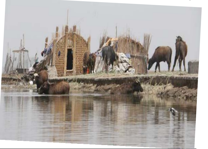
اهوار الجنوب قطعة من الجنة

في تلك المستعمرة المائية كانت الحياة الدائمة أجمل ما يمتلكه المكان وساكته، ومنهم معلمي المدرسة الخمسة، وكانت المراحل الدراسية فيها تصل إلى مرحلة