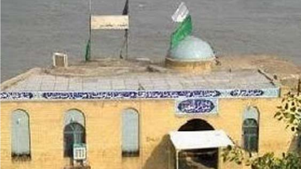
مقام: حي الدارين في الأهوار يحتضن مقام النبي الخضر

خشبية ومقاعد وابواب في المدينة الصناعية، مدينة النجف. تبدأ السيارة في الصباح بالسير البطيء متوجهة إلى مدن الأهوار في سفرة قد تستغرق أربع ساعات بالرغم من أن مسافة الطريق هي تسعة وثمانين كيلو متراً، لكن السائق يتوقف طوال هذه المسافة عدة مرات لتبريد السيارة وقد يتجاوز هذا التوقف الربع ساعة.