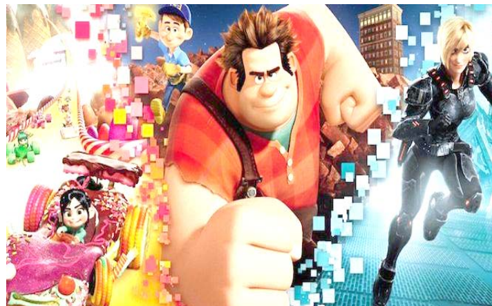
ملصق رالف بريكس ذا إنترنت

لوس أنجلوس (رويترز) - تصدر فيلم الرسوم المتحركة الجديد (رالف بريكس ذا إنترنت) إيرادات السينما الأمريكية في مطلع الاسبوع محققاً 55.7 مليون دولار. وجاء فيلم الدراما الرياضي الجديد (كريد 2) في المركز الثاني محققاً إيرادات بلغت 35.3 مليون دولار. والفيلم بطولة مايكل بي جوردن وسيلفستر ستالوني ونيسا طومسون ومن إخراج ستيفن كابل جونيور. وتراجع فيلم الرسوم المتحركة (ذا جرينتش) من المركز الثاني إلى المركز الثالث هذا الاسبوع محققاً إيرادات بلغت 30.2 مليون دولار. كما تراجع فيلم الإثارة والتشويق "وحوش رائحة" فانتاستيك بيسستس من المركز الأول إلى المركز الرابع بإيرادات بلغت 29.7 مليون دولار. والفيلم بطولة إيدي ريديمان وجود لو وجوني ديب وإخراج