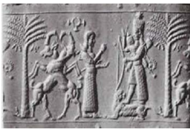
اثار حضارية قديمة تشتمل على النخلة