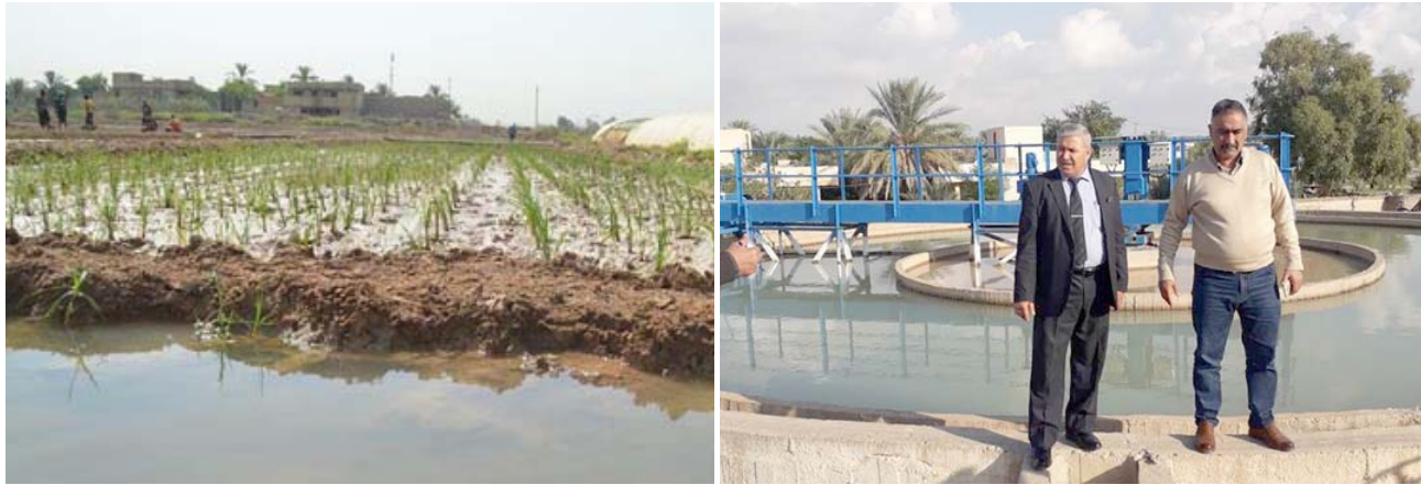
حقل ؛ منتسب الزراعة في حقل لصناعة البلوكات الزراعية

الحلبة بذور الخبار، البانجان، الباميا، الطماطة، الخ) التي تم إكتشافها من قبل الوزارة، تكون بذور الهجن المحلية ضمن البرنامج ذات صفات نوعية عالية من حيث الإنتاجية كمية، ونوعية وتحملها للتغيرات المناخية من ارتفاع وانخفاض درجات الحرارة، وملاحظة سرعة نمو محصول الخيار وعدد التفرعات والأزهار في كل نبات (كبير). وقد خرجت المشاهدة بعدة توصيات منها ضرورة خدمة المحصول بالطرق العلمية الحديثة من حيث التسميد الري، وإتباع الطرق الصحيحة في إضافة الأسمدة وتعليق النباتات.