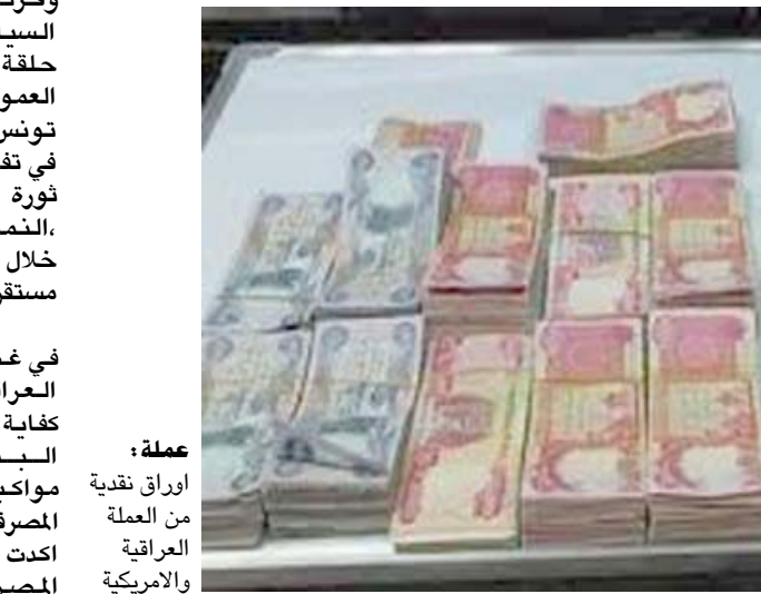
عملة : اوراق نقدية من العملة العراقية والأمريكية