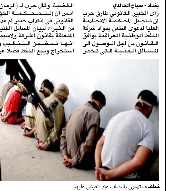
خطف، متهمون بالخطف عند القبض عليهم