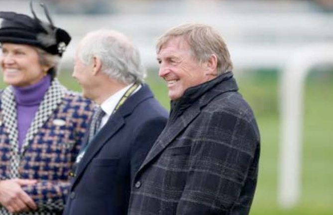
كيني دالغليش والأمير تشارلز

الناس ومساعدة الغير في وقت الحاجة". وحصل الأسطورة الاسكتلندي مع ليفربول كلاعب على لقب دوري الأبطال 3 مرات أعوام 1978 و 1981 و 1984 و الدوري الإنجليزي مرات، وكأس الاتحاد مرة واحدة. على صعيد آخر انضم ناديا سامبدوريا وجنوى، إلى أص من الأعمال الخيرية ومدينة ليفربول". وشهدت أسطورة ليفربول في الممثل توم هاردي، والمهاجم جيرمان ديفوي، والمبتكر جو مالوني على نفس اللقب. وقال دالغليش "أنا فخور، تفعل في الحياة ما علمته عائلتك أن تفعله، أي أن تتحلى بالثباتية مع