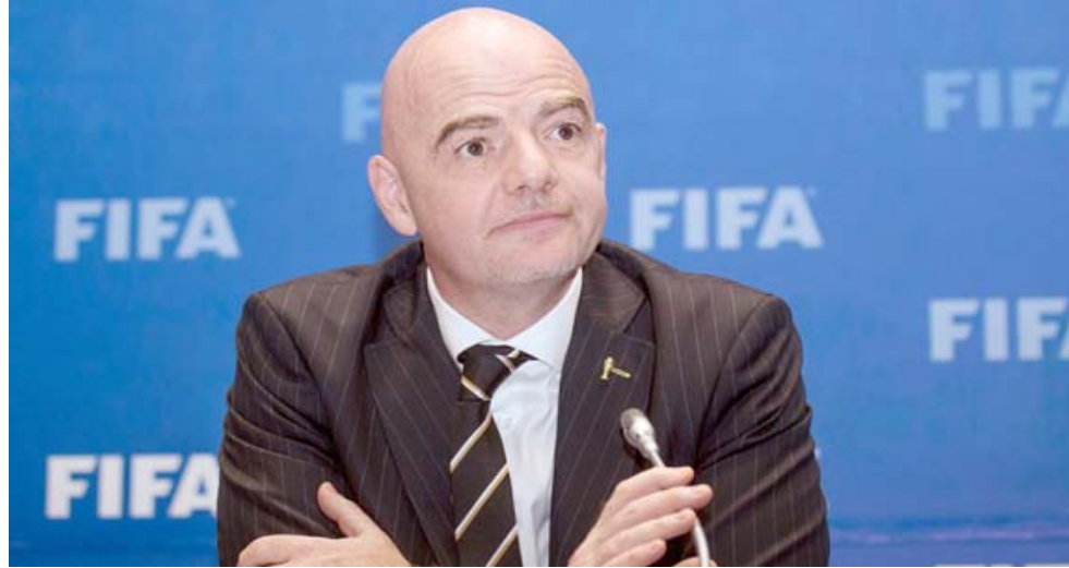
رئيس فيفا جاني إنفانتينو وريتير

لوزان (سويسرا)، (ا ب ب) عقدت مجموعة عمل الاتحاد الدولي لكرة القدم "فيفا" التي اوكلت اليها مهمة مناقشة توسيع كأس العالم للأندية واستحداث الدوري العالمي للأمم، أول إجتماع لها الخميس بمشاركة الاتحادات القارية بحسب ما علم الجمعة. وتقرر إنشاء مجموعة العمل هذه في نهاية تشرين الأول/أكتوبر في إجتماع مجلس فيفا في كينغالي، للرد على معارضة عدد من الأطراف الفاعلين لفكرة توسيع كأس العالم للأندية وإقامة الدوري العالمي للأمم، بما في ذلك الاتحاد الأوروبي لكرة القدم. وعقدت مجموعة العمل إجتماعها الأول الخميس عبر الهاتف، وشارك فيه أعضاء عام الاتحادات القارية أو (ا ب ب) عقدت مجموعة عمل الاتحاد الدولي لكرة القدم "فيفا" التي اوكلت اليها مهمة مناقشة توسيع كأس العالم للأندية واستحداث الدوري العالمي للأمم، أول إجتماع لها الخميس بمشاركة الاتحادات القارية بحسب ما علم الجمعة. وتقرر إنشاء مجموعة العمل هذه في نهاية تشرين الأول/أكتوبر في إجتماع مجلس فيفا في كينغالي، للرد على معارضة عدد من الأطراف الفاعلين لفكرة توسيع كأس العالم للأندية وإقامة الدوري العالمي للأمم، بما في ذلك الاتحاد الأوروبي لكرة القدم. وعقدت مجموعة العمل إجتماعها الأول الخميس عبر الهاتف، وشارك فيه أعضاء عام الاتحادات القارية أو