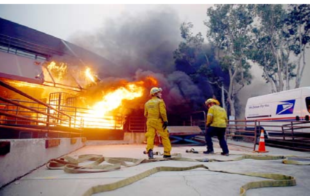
حرائق : رجال الاطفاء يعالجون حرائق المنازل في كاليفورنيا

المعلبة والحبوب والسكر والرذ بين المتكويين). وفي الولايات المتحدة ارتفعت حصيلة الحرائق التي تتخاض كاليفورنيا منذ ثلاثة ايام إلى 23 قتيلاً، فيما افادت دائرة الغابات والحماية من الحرائق بإحراق 40 ألف و 500 هكتار من الأراضي حتى الآن من جهتهم أكد عناصر الإطفاء ان السيطرة الكاملة على هذه الحرائق التي تعد الاخطر تدميراً بتاريخ كاليفورنيا ستستغرق نحو ثلاثة أسابيع.