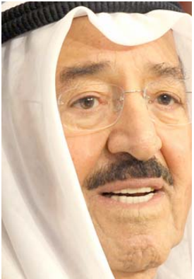
صباح الاحمد الصباح

مؤكداً ان العراق يبدي استعداده على المستويين الشعبي والرسمي بمساعدة دولة الكويت الشقيقة في تجاوز أزمته). ومن المقرر ان تشهد الزيارة تسليم الكويت دفعة من الممتلكات والمواد الأرشيفية المفقودة الموجودة في خزائن وزارة الخارجية العراقية، على ان يتم تسليم بقية تلك الممتلكات على دفعات لاحقة، حسب صالح من جهته جدد الصباح في بداية اللقاء تهنئته لصالح بمناسبة توليه رئاسة الجمهورية. وأكد ان دولة الكويت لن تدخر جهداً في مساعدة العراق والوقوف الى جانبه في مرحلة إعادة الامار بعد القضاء على عصابات داعش الإرهابية). ووصل صالح صباح أمس الأحد إلى الكويت في زيارة رسمية تهدف إلى تعزيز سبل التعاون بين البلدين كان على رأس مستقبليه، أمير دولة الكويت صباح و رئيس مجلس الوزراء ومرزوق العليان وعدد من الوزراء والمسؤولين. وضم الوفد العراقي وزير الخارجية والصناعة ورئيس جهاز المخابرات ومحافظ البصرة. و بعد ان المستشارين والخبراء من جهة أخرى دعا رئيس تيار الحكمة عمار الحكيم الحكومة والمنظمات المجتمعية إلى الوقوف مع الكويت والأردن وتشجيع الإمكانيات اللازمة من أجل تجاوز أزمة السول. وقال في بيان امس ان أعلن عن تضامناً مع الدولتين الشقيقتين دولة الكويت والمملكة الأردنية الهاشمية كجولة وسعياً وذلك للعرضها إلى كيفية نتيجة الاضرار الخيرية، ومراجعة حسابات الجوار وإغاثة المحتاج. كما أشادت الحكومة العراقية والمنظمات المجتمعية على (الوقوف معهما وتأييد كافة الإمكانيات اللازمة من أجل تجاوز الأزمة). في غضون ذلك،