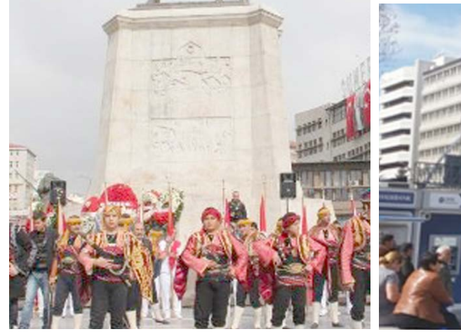
استعراض تحت تمثال أتاتورك

المدينة كما تعد حديقة وبحيرة جول باشي من أجمل حدائق أنقرة والتي لاتعد من مركز المدينة سوى نصف ساعة من الوقت مع تيسر وسائل المواصلات منها واليهما ومن أشهر حدائق أنقرة واخترها متعة وإثارة للعباب والصغار أيضا حديقة أرض العجائب التي افتتحت عام 2004 مستدة على مساحة تصل إلى متر مربع لتكون من اكبر 1.320.000 حدائق أوروبا وتنقسم مساحاتها بين مساحة خضراء زروعة ومساحة أخرى مخصصة للبحيرات الاصطناعية وتنتشر في أرجاء المدينة ان الحدائق الكرونية المشحونة وتوفر الحديقة كافة متطلبات ممارسة الأنشطة الرياضية مثل ألعاب السلة وملعب التنس وملعب الغولف وحلبة تزلج ومسارح ومعارض مقفلة استيعاب تصل إلى 5000 شخص كما تقام فيها الكثير من الفعاليات والأنشطة الثقافية والترفيهية أما اماكن التسوق المفضلة لدى السياح الأجانب .