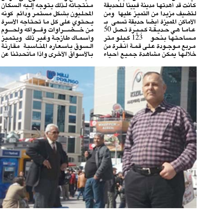
الزمان) وسط أنقرة العاصمة السياسية