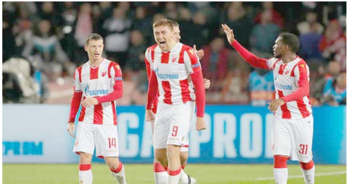
فوز، نجح النجم الأحمر ليفربول واناش دورى الأبطال

، حيث كان البلجورجنا متفوقاً بوضوح وأكثر قدرة على تحقيق الانتصار، حيث سد لاعبو البرسا 8 تسديدات على المرمرى، مقابل تسديدة واحدة فقط من جانب الخيراتزوري، وكانت التسديدة التي أتت منها الهدف، تموقع لاعبي برشلونه في لحظة هدف إيكاردى غريب وغريب للسخاية، لا يمكن قبول فكرة أن سيرجي روبرتو المدافع الأيمن هو من كان في رقابة الأرجنتيني في هذه اللحظة وليس أحد فئاتي الدفاع: بيكيه ولينجليه، حتى إن أحد لاعبي إنتر كان خالياً من الرقابة على يسار منطقة الجزاء، أي إن إيكاردى كان يمكن أن يمرر له الكرة وكانت ستصبح فرصة هدف محقق على مرمرى ثير شنيجن. إنتر ميلان حاول الاعتماد على الهجمات المرددة في الشوط الثاني، ولكن حيوية سواريز ومهارة كوتينيو اتعبا وسط ملعب الأفاعي كثيراً وكاد برشلونه يسجل هدفا سهلاً للسخاية عن طريق راكيتيش من وضعية انفراد، ولكن الكرواتي أهدر الفرصة بطريقة غريبة جداً.