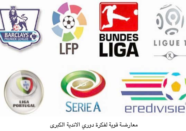
معارضة قوية لفكرة دوري الأندية الكبرى

أبدت رابطة الدوريات الأوروبية لكرة القدم معارضتها لما كشفت عنه تسريبات 'فوتبول ليكس'، من بحث الأندية الكبرى في القارة بإنشاء 'سوبر ليغ' (دوري سوبر)