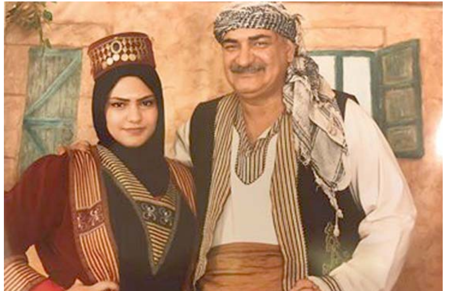
ملابس تقليدية يرتديها السياح