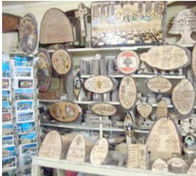
صناعة يدوية لبنانية للتذكارات

نصب حريصة في جونية يمثل السياحة الدينية في لبنان، وهو يقع فوق تلة جبلية. ويعد من ابرز أماكن الحجيج للطاقنة المارونية، وكافة المسيحيين في لبنان وياقي المول. كما ان كل سائح لا بد ان