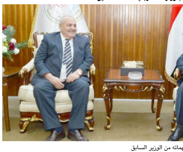
تسلم؛ وزير التعليم العالي وكالة يتسلم مهامه من الوزير السابق