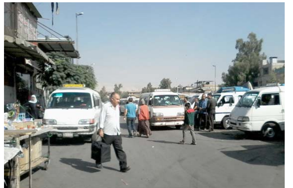
تدافع ركاب من الجنسين في تدافع على حافلة

بالتنسبة لخط بشكو تضخم عدد المنتظرات، فانهم شمروا عن اعداد المنتظرين مع نهاية توام وزارة العلوم والتكنولوجيا المغاة الحافلات (الكوستر) التي تعمل على خط الباب الشرقي -كراة داخل الى تحمل سقوط زخات المطر. واستغرق وصول واحدة من تلك الحافلات نحو نصف ساعة من الانتظار، وهو وقت طويل