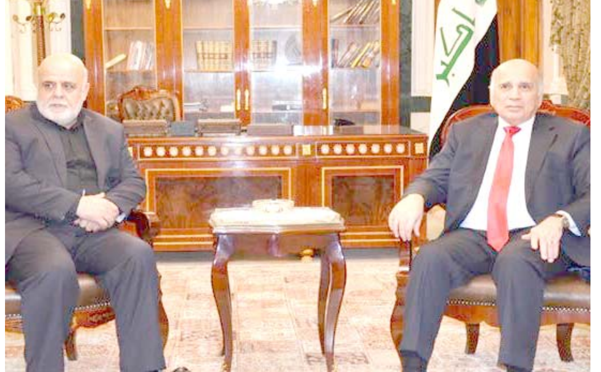
لقاء : وزير المالية فؤاد حسين خلال لقائه السفير الإيراني في بغداد

الى الإهتمام اكثر بالشركات الصغيرة والمتوسطة في مجال الصادرات وعلى المصارف الصارمات ومؤسسات لضمان المالي ان يكون لها دور مهم في مجال ضمان الصادرات مع نظرائه في العالم في اصدار خطابات الضمان، مؤكدا ان (في الأشهر السبعة الماضية العام الصافي حققت الصادرات الى العراق نحو 8 مليارات دولار وعلى هذا الاساس فان ، صندوق ضمان الصادرات يجب ان يفتح فرعا له في العراق). الى ذلك حذر وزير الخارجية التركي مولود تشاوش أوغلو واشتطن من عقوباتها الجديدة على إيران كونها مسألة خطيرة. وقال أوغلو خلال زيارته إلى اليابان انه (في الوقت الذي طلبنا فيه إعفاء من الولايات المتحدة وناكدينا على ان حشر إيران في الزاوية ليس من الحكمة ولاسيما ان عزلها يعد مسألة خطيرة ومن غير العدل معاقبة (الشعب). وأضاف ان (تركيا ضد فرض عقوبات، ولا نعتقد بأنه يمكن التوصل لاي نتيجة من خلال العقوبات). وتابع (اعتقد انه بدل العقوبات، فإن اجراء الحوار يعود بالفائدة اكثر من فرض العقوبات). ودخلت الدعفة الثانية من العقوبات الأمريكية على إيران حين التنفيذ الاثنى الماضي والتي تستهدف قطاعي النفط والمال والحيويين في البلاد مع إعفاء ثمانية دول بينها تركيا