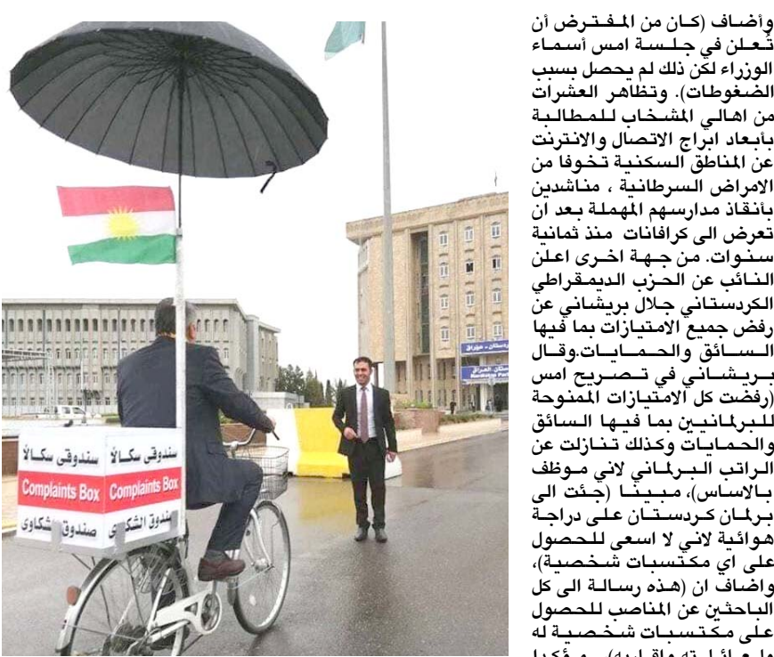
دراجة : النائب عن الحزب الديمقراطي الكردستاني جلال بريشاني على دراجة هوائية ملتحقا بمهمة البرلمان.