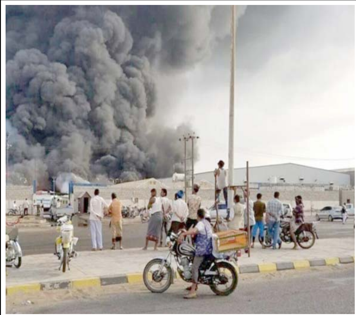
استهداف: آثار الضربة الجوية التي استهدفت مركبتين في مدينة الحديدية اليمنية