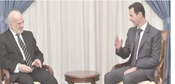
لقاء: الرئيس السوري خلال لقائه في دمشق وزير الخارجية ابراهيم الجعفري

الزيارة مع استعداد الجيش السوري لأغلب الأراضي المحتلة من قبل تنظيم داعش وصولاً للحدود مع العراق. وفي جنيف أكد رئيس البرلمان المصري على عبد العال أهمية استمرارية العراق في تحقيق السلام بمنطقة الشرق الأوسط مشيداً بمجهود القوات الأمنية في القضاء على التنظيمات الإرهابية. جاء ذلك خلال لقاء النائب الأول لرئيس المجلس حسن كريم الكعبي، ورئيس النيابة المرافق له بعد العال على